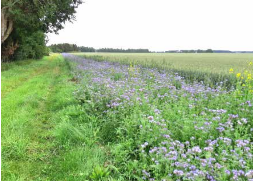
Honungsört ger både föda och skydd åt raphöns och fasaner och där trivs en mångfald av insekter.