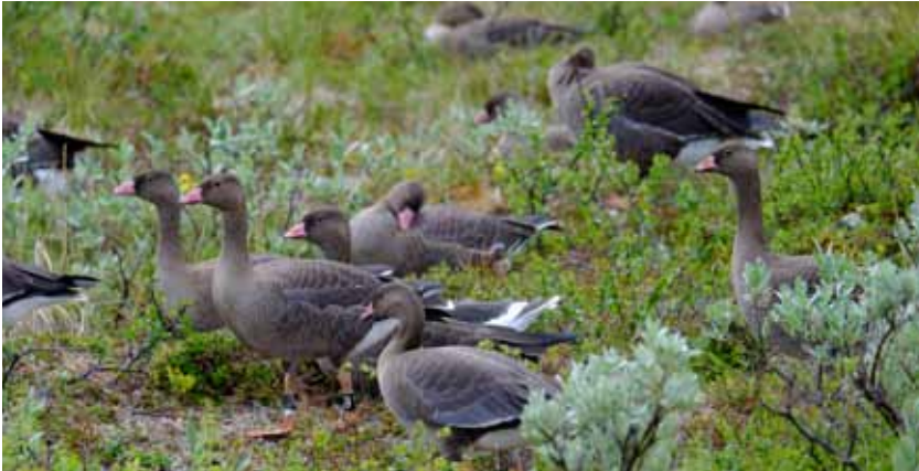
En flock med utsättningsfåglar i häckningsområdet den 29 juli.