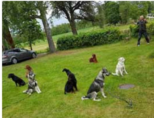
Under två långhelger utbildades blivande hundinstruktörer.

I maj och juni genomfördes instruktörsutbildningen "Steg 1 - Grundkurs för lydoadsinstruktör", i Västmanlands län i närheten av Strömsholm. Deltagare var elva blivande instruktörer från Södermanland, Stockholm, Uppsala, Västmanland, Dalarna, Östergötland och Blekinge.