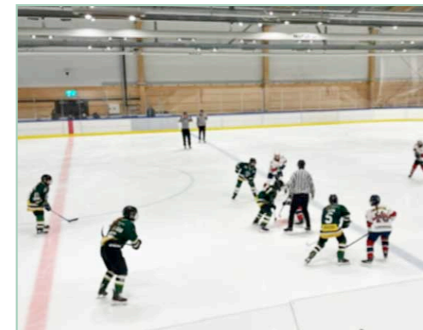
Match ESK-Sollentuna/Österåker F16 den 14 mars 2024 Slutresultat 3-2.

Inför säsongen framgick att Uppland inte kunde arrangera en egen F16-serie, då få klubbar hade lag i detta ålderssegment. Detta innebar att Region Öst i stället arrangerade seriespel. Här ställde hela 19 lag upp och serien delades i tre delar. Här startade Enköping i grupp Nord där man mötte motståndare som Väsby/Bålsta/Uppsala, Hässelby Kälvesta, Skärplinge, Almtuna och Sollentuna/Österåker. I denna serie slutade Enköping på en fjärdeplats. Ny lottnings genomfördes och i nästa serie blev tre av motståndarna samma som tidigare men Sudret från Gotland tillkom. Säsongen kommer strax avslutas och det är idag (14/3) klart att striden om tabellsegern står mellan Enköping och Sollentuna/Österåker.