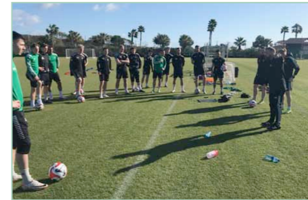
Genomgång före träning.

I början av mars åkte cirka 40 spelare, ledare och sponsorer till spanska Estepona för en knapp veckas träningsläger.