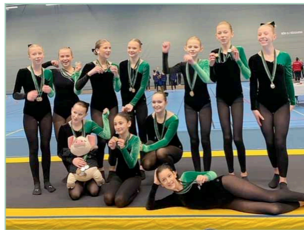
Trupp Röd, tävlande i nivå 7.

I nivå sju tävlade två lag från Trupp Röd och ett lag från Trupp Grön. Här delas medalj ut i varje gren som är tumbling/matta, hopp och fristående.