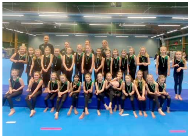
Trupp Blå, tävlande i nivå 8.

Vi arrangerade en regiontävling med tre olika nivåer, från åttan till sexan.