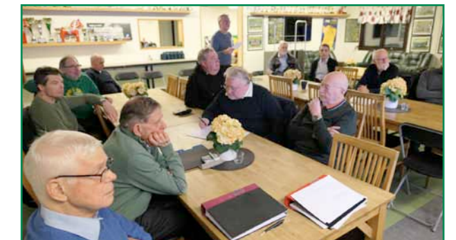
Mötesdeltagarna lyssnar intresserat på föredragande.

De tackade också väldigt mycket för det funktionärs- och måltidsstöd som de har fått av Club 100.