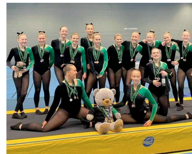
Del av Trupp Grön, tävlande i nivå 6.

Våra trupper presterade på topp och vi fick med oss en medalj i varje valör.