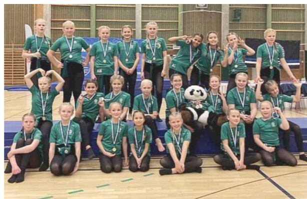
Trupp Grön, tävlande i nivå 7.