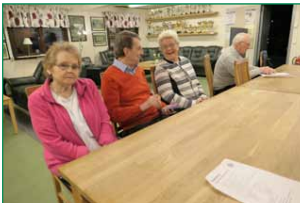
Glada och intresserade mötesdeltagare.