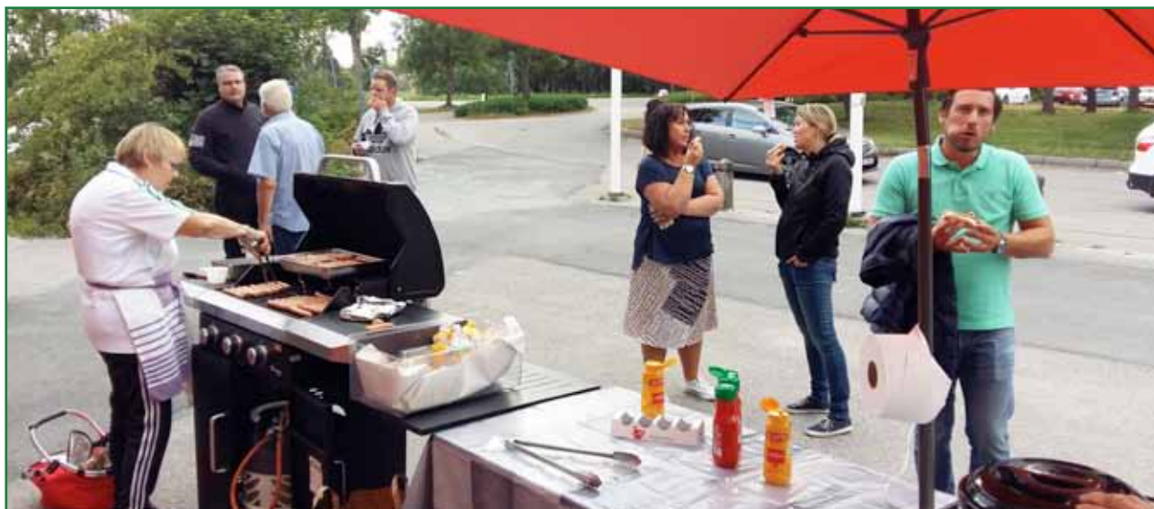
Traditionsenligt så hade ESK Chub 100 anordnat korvgrillning vid hockeysäsongens första isträning.

Vi har en aktiv sida på instagram under hashtagen #eskhockeyungdom där kan man följa våra ungdomars vardag.