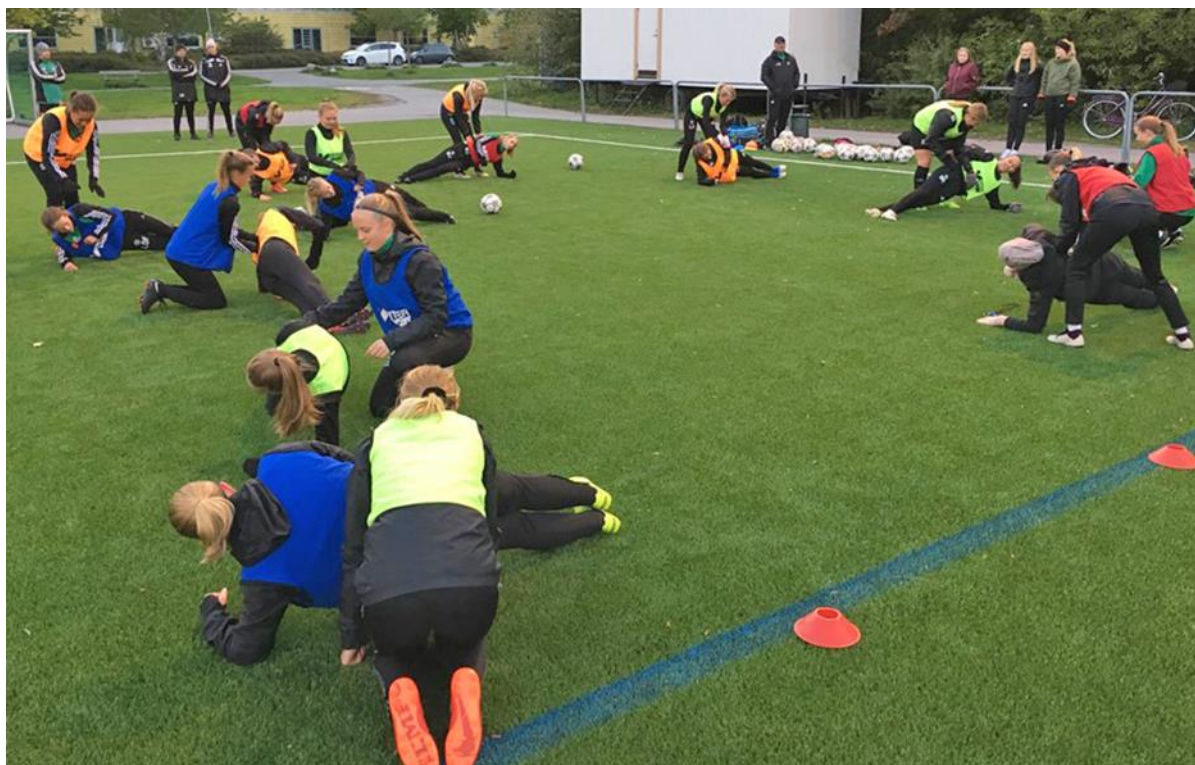
Bild1: Med en bra veckoplanering möjliggör vi att våra träningspass blir allsidiga – såväl i träning med fotbollen i fokus, som den viktiga fysträningen som bygger fysiken för mängden träning och minskar skaderisken.

Genom att logga in på SvFF spelarutbildningsplan finner du stöd i valet av övningar och andra rekommendationer specifikt för din spelform.