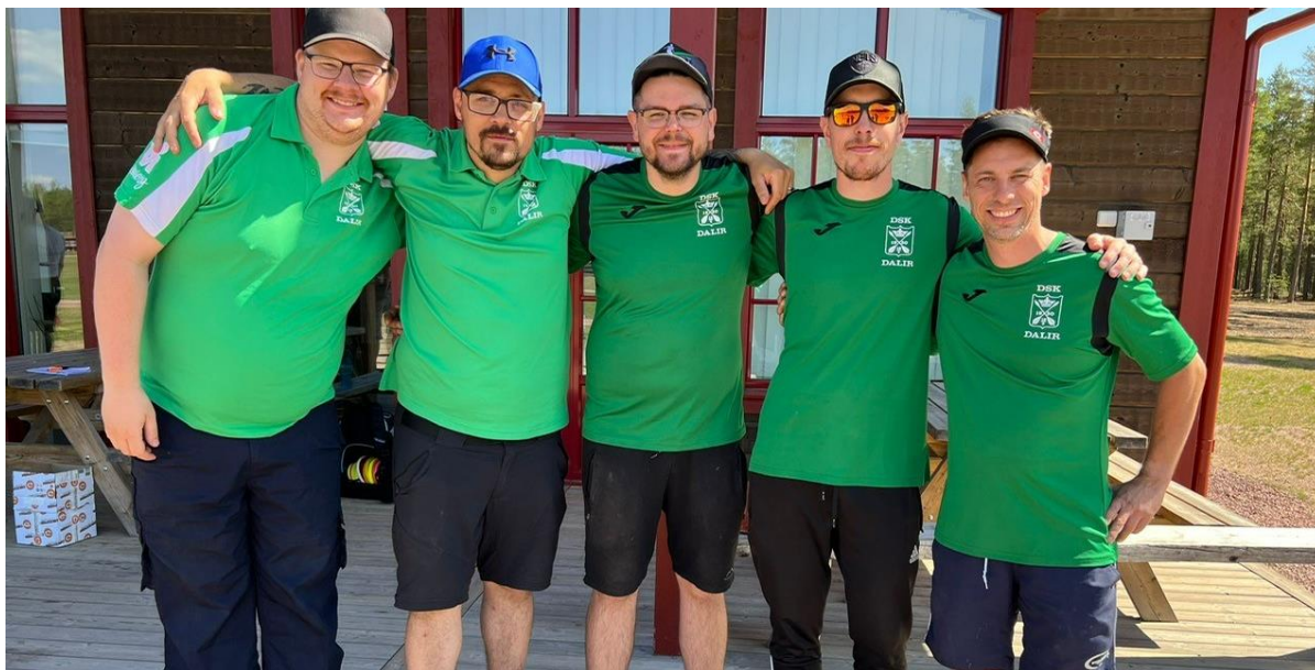
Vid SM i Mora