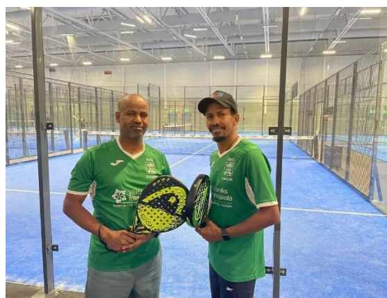
Dala-paret vid SM (par) i Göteborg