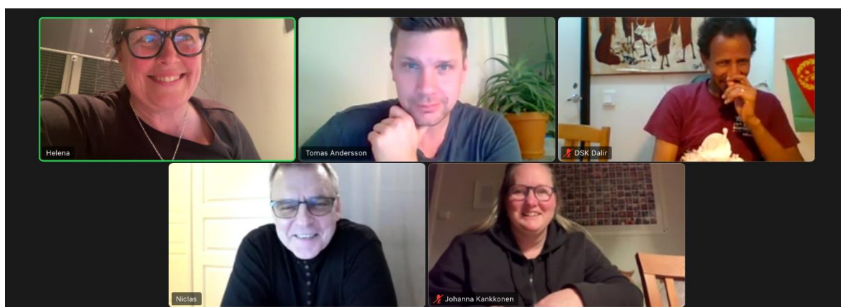
Styrelsen under ett av styrelsemötena under året