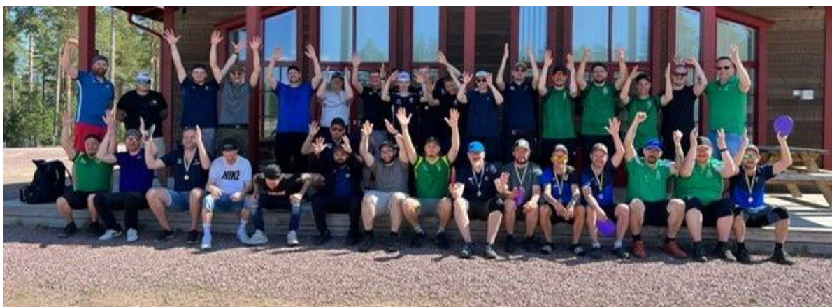
Discgolf (par-SM) i Mora (maj 2023)

Sammankomster som planerats både på lokal och riksnivå (SDI) har varit fysisk. Lokalt (som till exempel årsmöte), har kunnat vara hybrida (både på plats och digitalt).