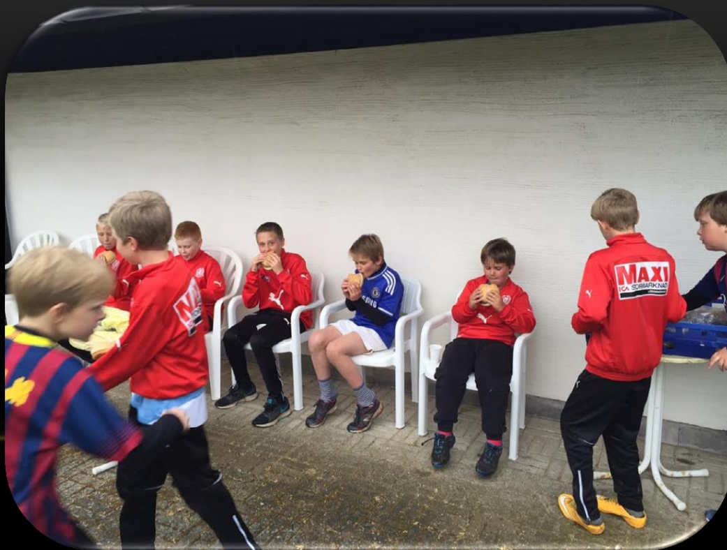
Matdags efter två omgångar fotbollsbrännboll och fotbollsgolf..