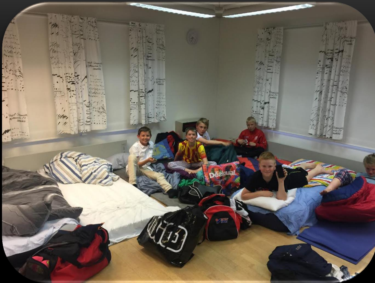
Madrasserna på plats inför filmen