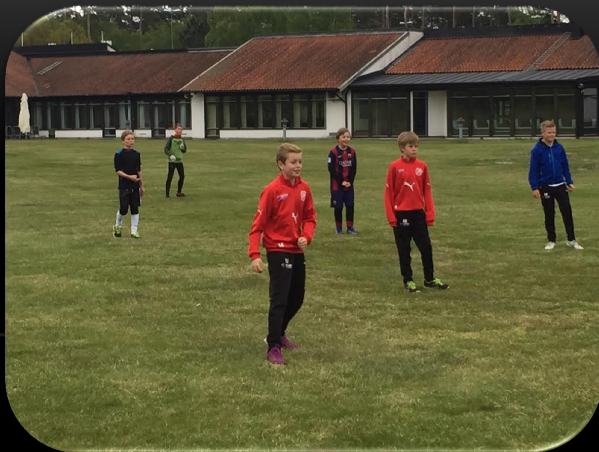
Utelaget runda ett