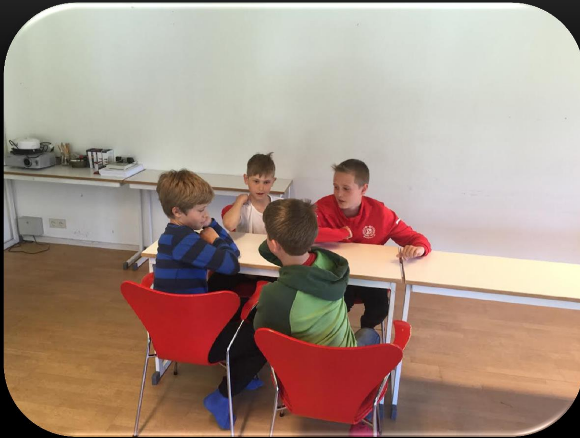
Efter frukost var det dags för grupparbete Grupp 1