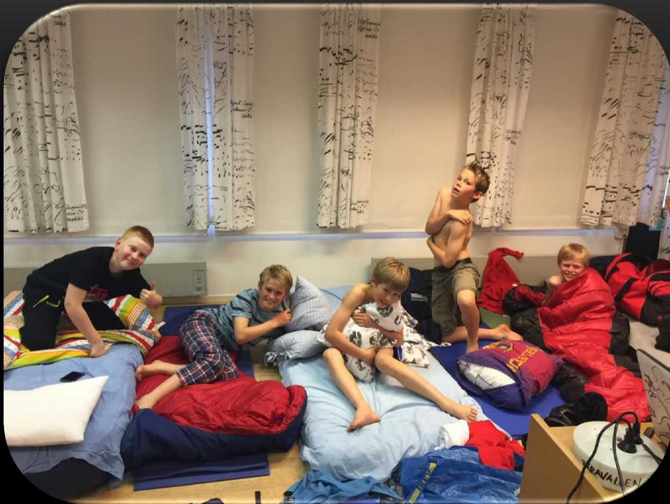
Madrasserna på plats inför filmen