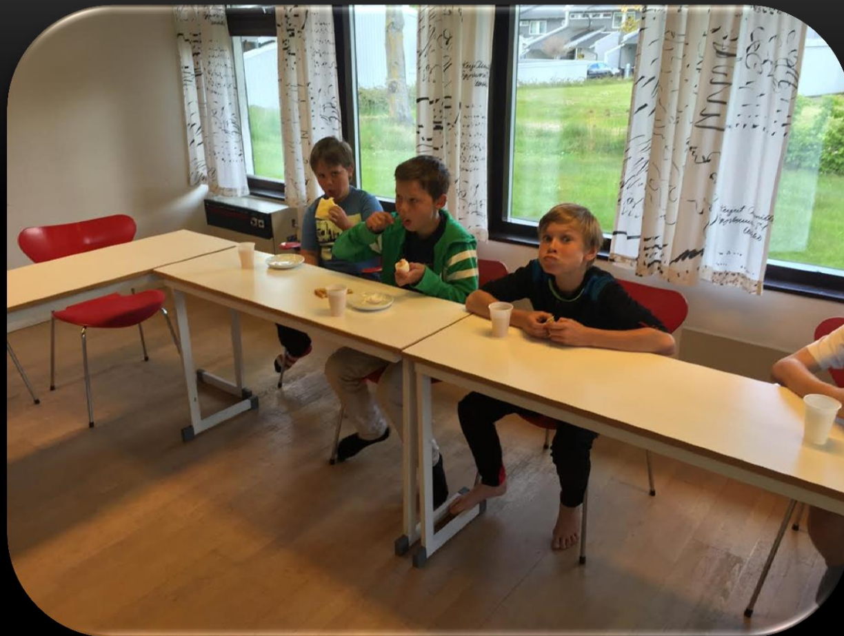
Madrasserna undanplockade och dags för frukost..