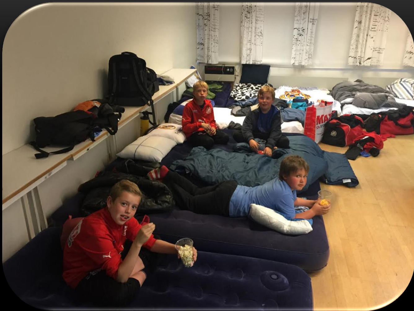
Madrasserna på plats inför filmen