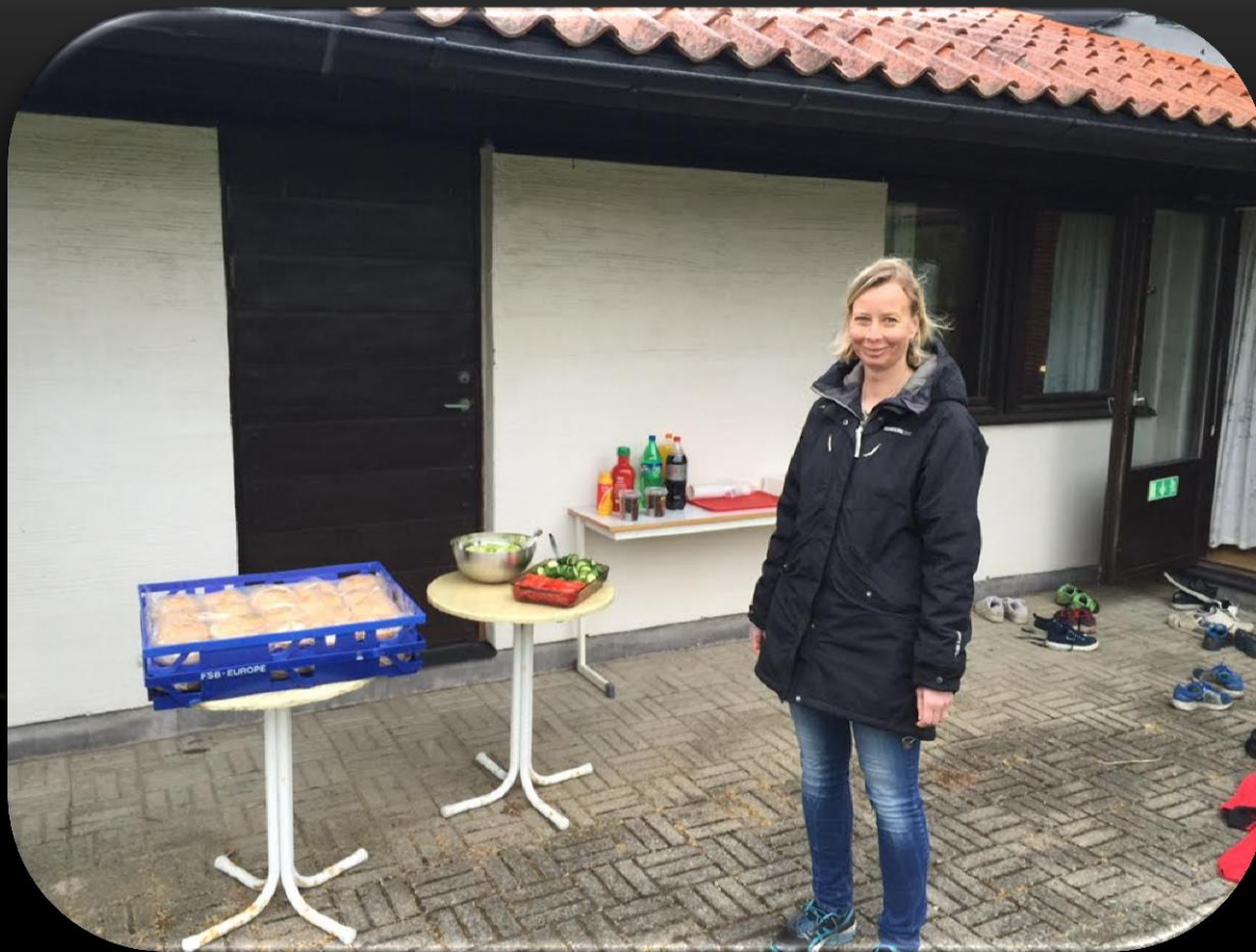
Helena har koll på alla tillbehör 😊