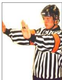
Check fr. behind