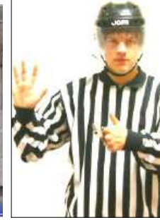
Too many pl.