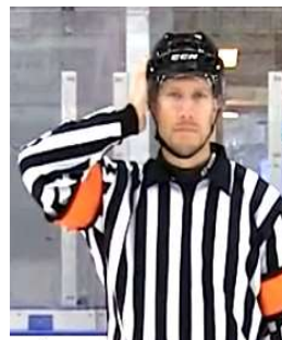
Checking to the head