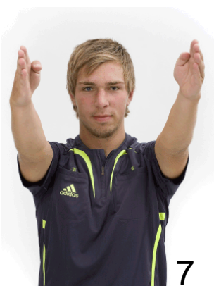
7 Inkast - riktning