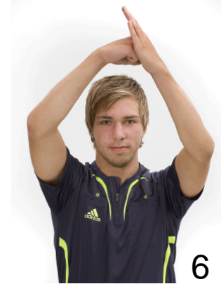
6 Offensivt fel