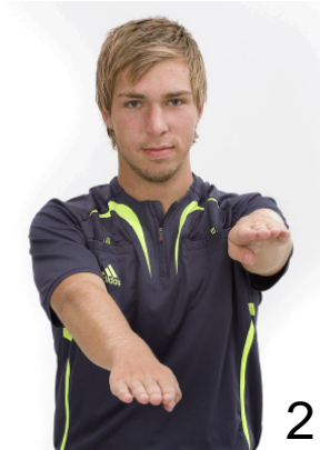
2 Felaktig dribbling