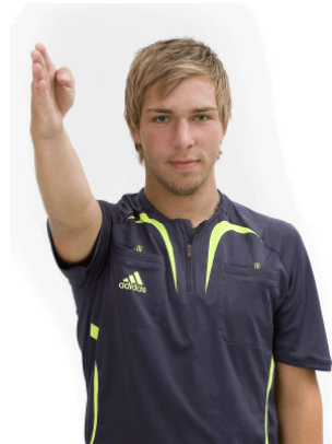
8 Frikast - riktning