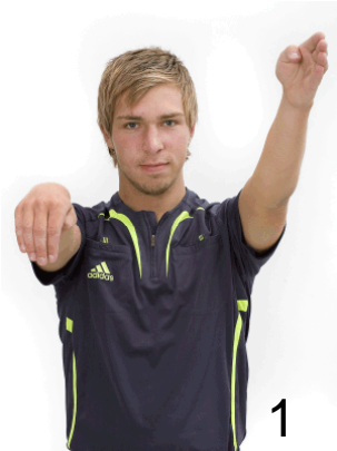
1 Beträdande av målgården