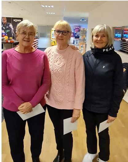
Vinnarna utan HCP