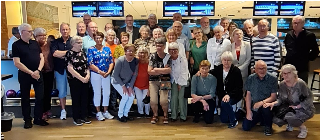
En av grupperna på säsongsavslutningen 19 maj