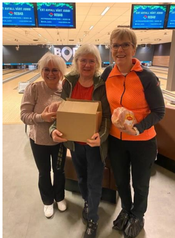
Vinnarna med HCP