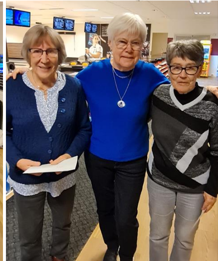
Vinnarna med HCP