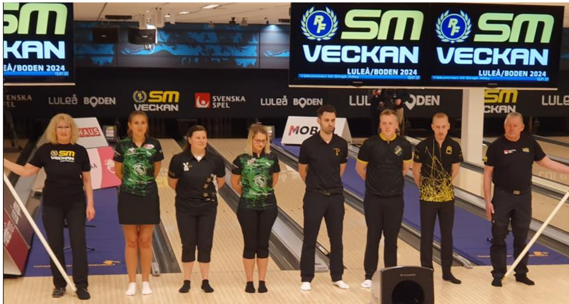
Deltagarna under SM i bo