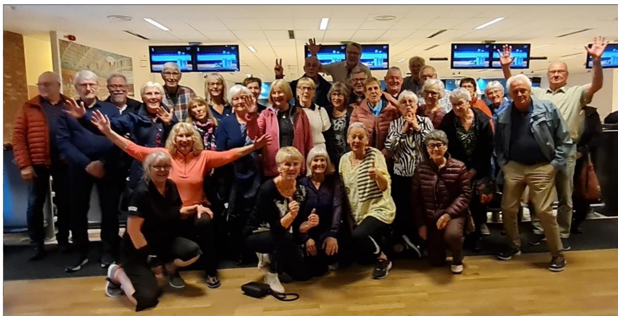
Bilden tagen från uppstartsmötet den sjunde oktober 2023