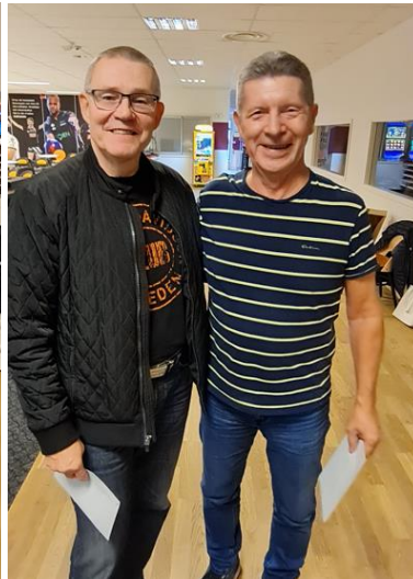
Ettan och Trean med HCP