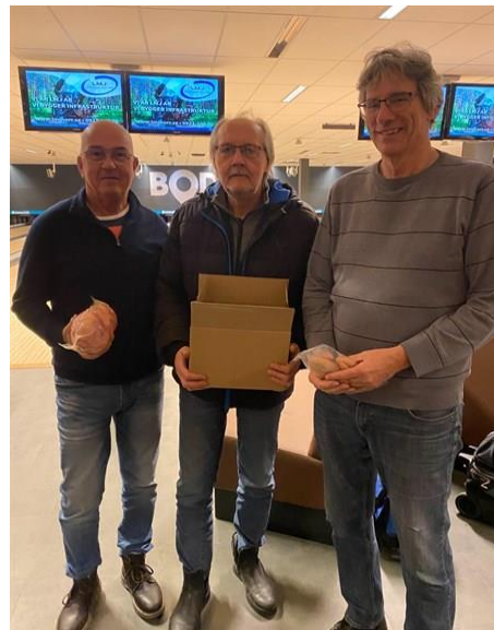
Vinnare utan HCP