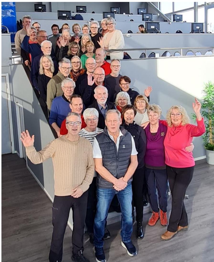
Lunch på travet inför SM-veckan

Folkspel har presenterat en ny spelform JOYNA, som genererar intäkter på 50 kr/prenumeration/mån för varje såld prenumeration. En prenumeration kostar 160/månad för fyra dragningar. Dels kan medlemmen själv vinna allt mellan 40: - t.o.m. en miljon, dels att föreningen är med i dragningen och kan vinna 100 000: - Några medlemmar provade spelet under hösten 2024.