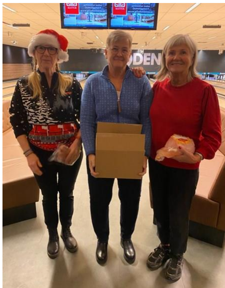
Vinnare utan HCP