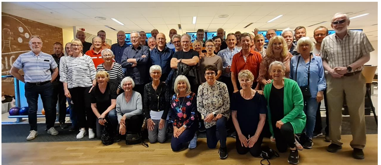
Andra gruppen 19 maj