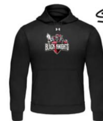
BLACK KNIGHTS HOODIE