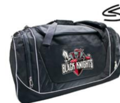
BLACK KNIGHTS BAG