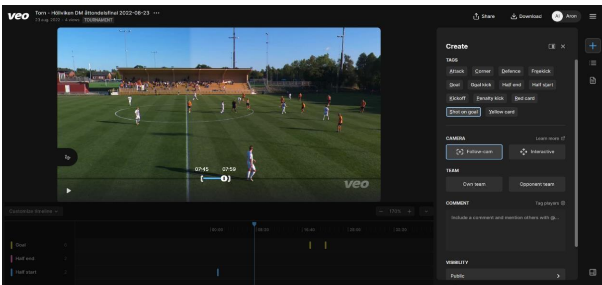
Bild på hur editorn ser ut och hur man skapar klipp.