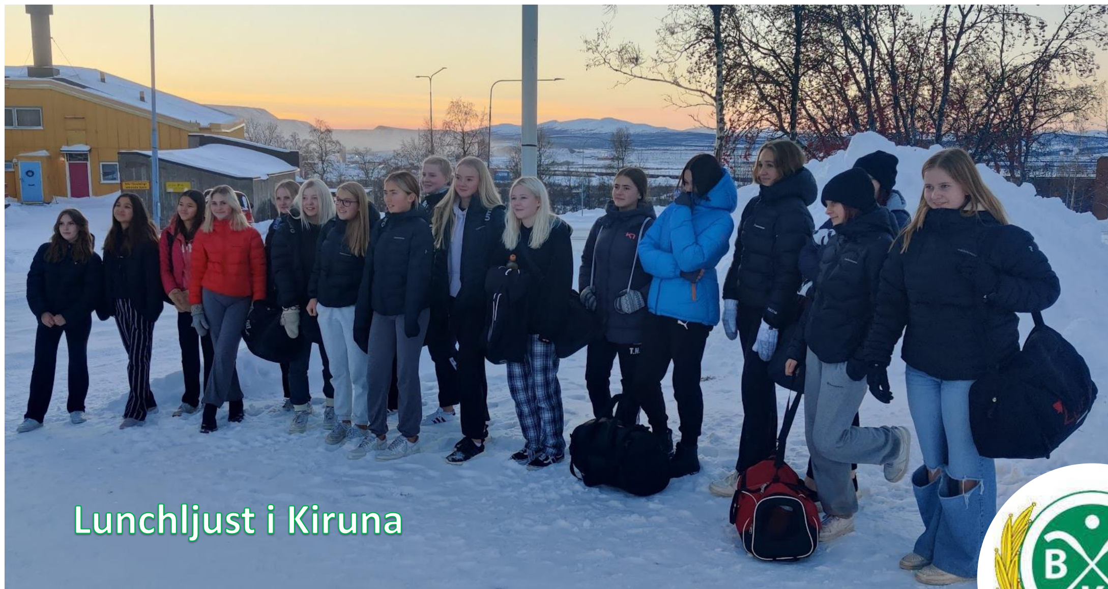
Lunchljust i Kiruna