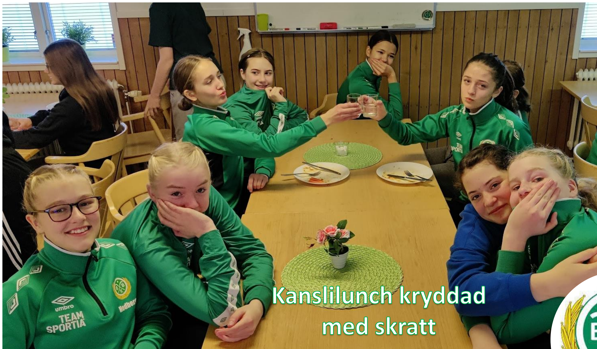
Kanslilunch kryddad med skratt