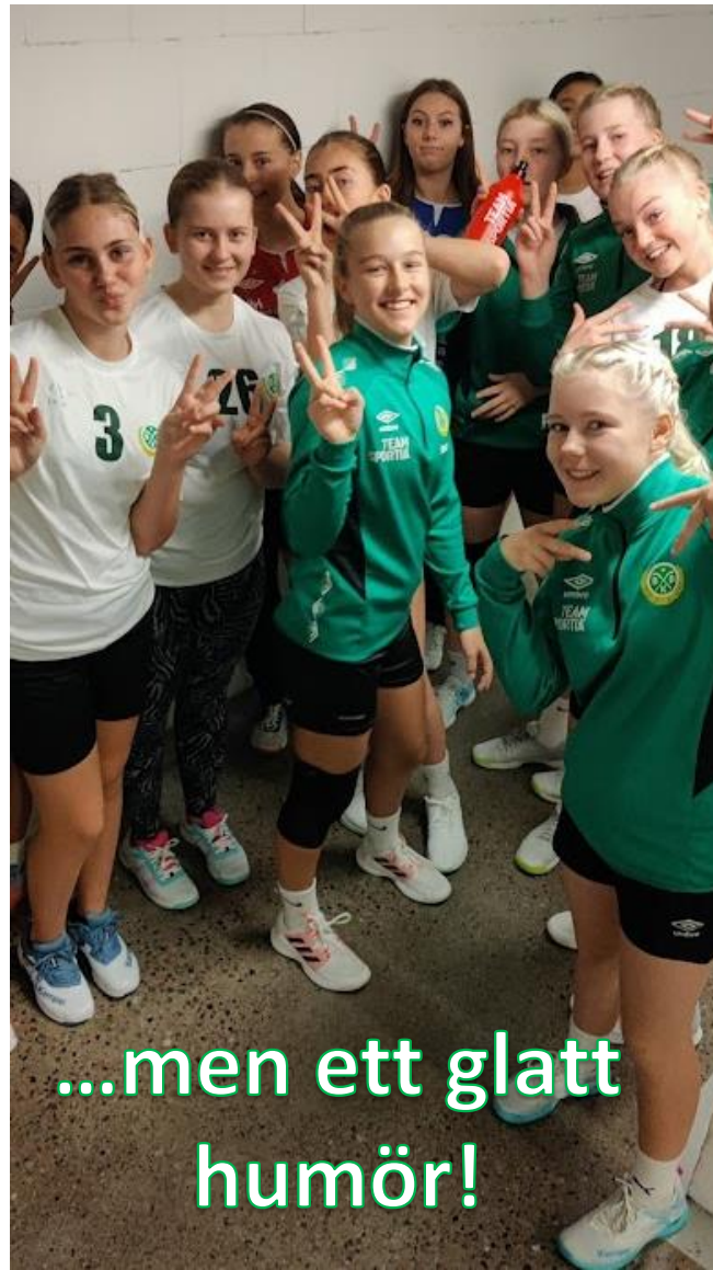
...men ett glatt humör!