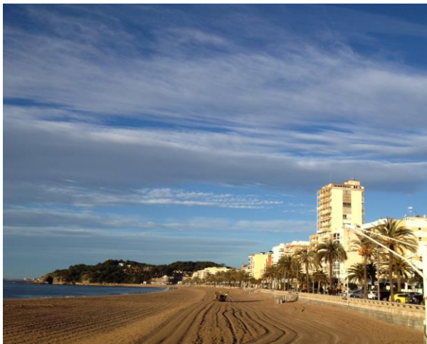
Börja dagen med lite jogg på stranden.