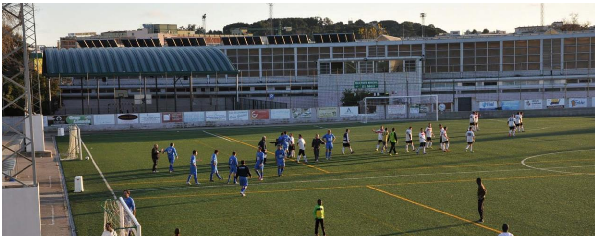
Ni tränar på fina och moderna konstgräsplaner.