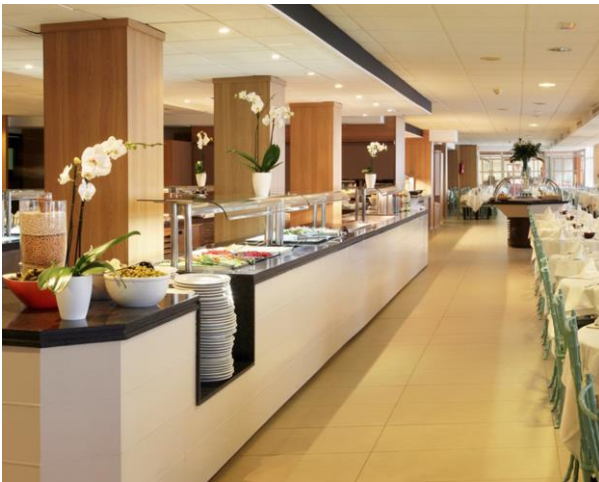
Måltiderna serveras som buffé på hotellet.