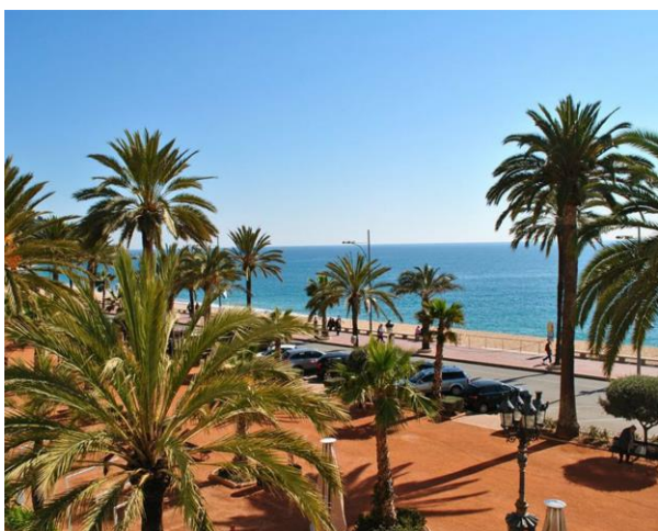
Ni bor med närhet till havet där ni kan svalka er mellan träningspassen.