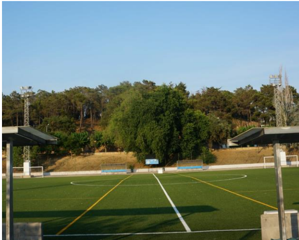
Planerna ligger en på promenadvstånd.