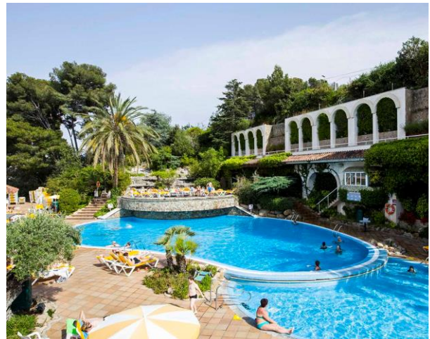
Hotellet har ett fint poolområde.