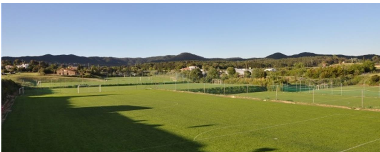
Träning på naturgräs finns mot tillägg.