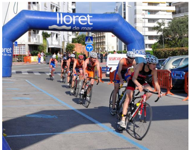
Lloret de Mar är en stad som andas idrott.