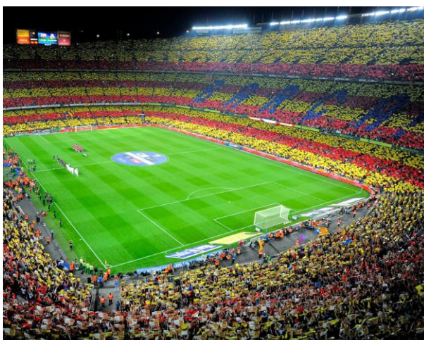
Åk till Barcelona och se FC Barcelona spela på Camp Nou! Kontakta oss för mer information!