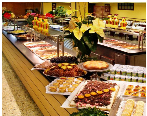
Ni äter er mätta på hotellets buffé.