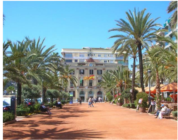
Lloret de Mar bjuder på skönt medelhavsklimat.