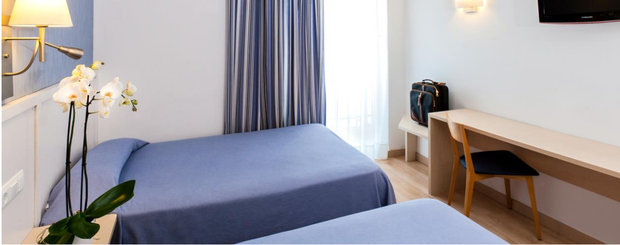
Ni bor i trebädds-, dubbel- eller enkelrum.