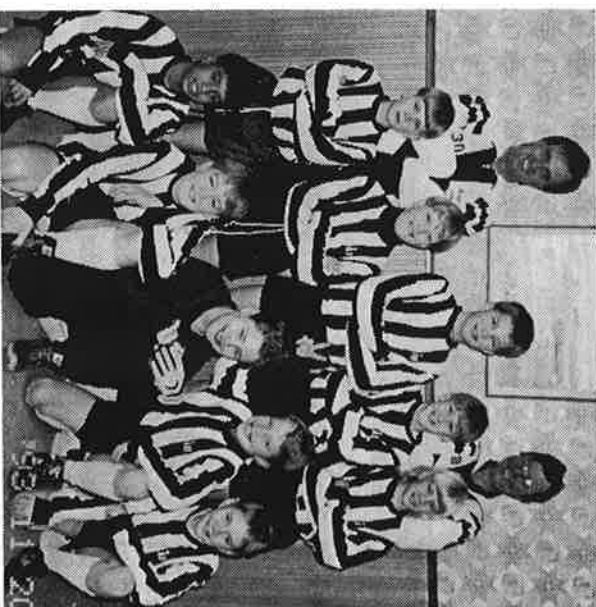
P11-laget med ledare i full mundering

song som 7-mannalag. 1996 är det alltså dags att börja spela "riktig" 11-mannafotboll.