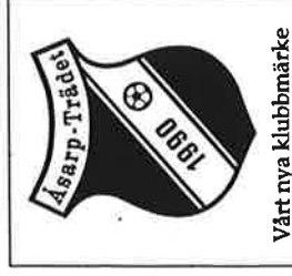
Vårt nya klubbmärke

Spelaren utvisas för lindrig förseelse och blir följaktligen avstängd även nästa match i samma tävling. Detta är den enda sorts situation då en spelare kan utvisas för lindrig förseelse utan att tidigare under matchen blivit varnad.