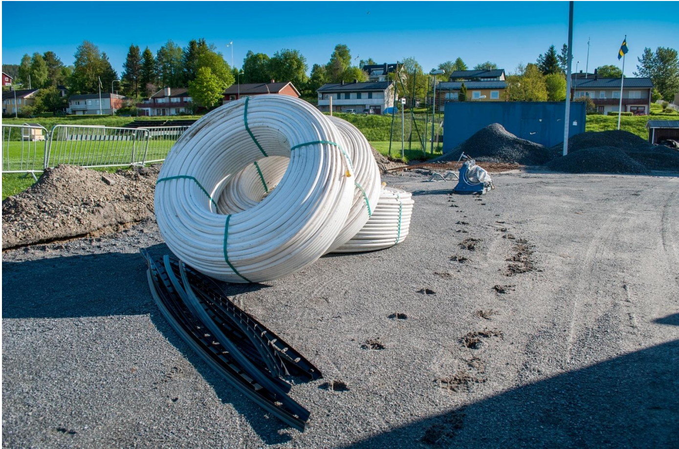
ÖSK Hockey har lagt ut kylslang på 7-manna grus.