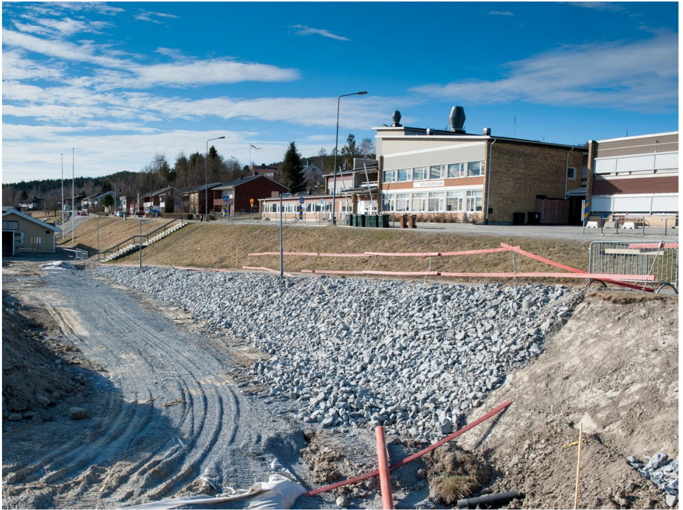
Slänterna mot planen börjar ta sin slutliga form