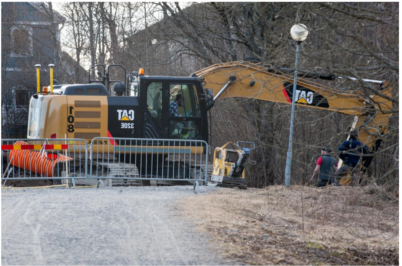
Grävning av dränering under gångvägen.