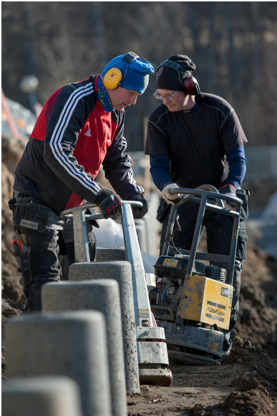
Packa matreial runt fundamenten