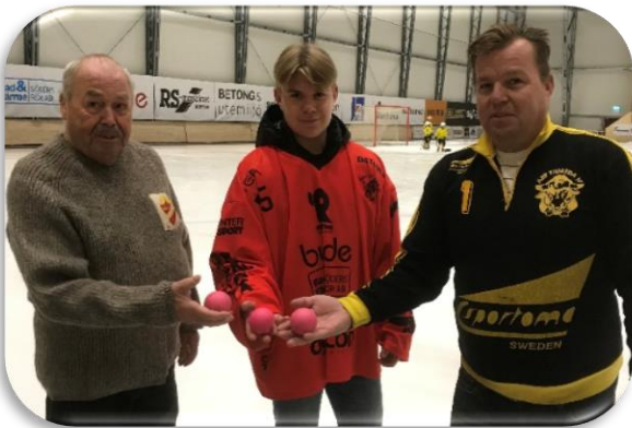
På bilden ser vi tre generationer bandymålvakter i tre generationers målvaktströjor.

Traditionens makt är stor. Generationer följer varandra. Äpplet faller inte så långt från osv. Dessa talesätt är rätt vanliga inte minst inom idrotten. Man kan ofta följa generation efter generation. Familje-traditionen är på ett särskilt sätt utmärkande. Det har vi under årens lopp även sett i vår förening både inom fotboll och bandy. Att följa i traditionens spår kan vi nu se i bandyn.