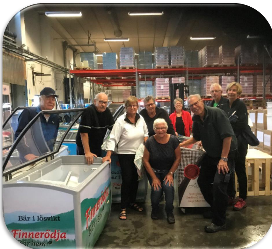
Ett glatt gäng efter sju onsdagsförmiddagar och betinget avklarat