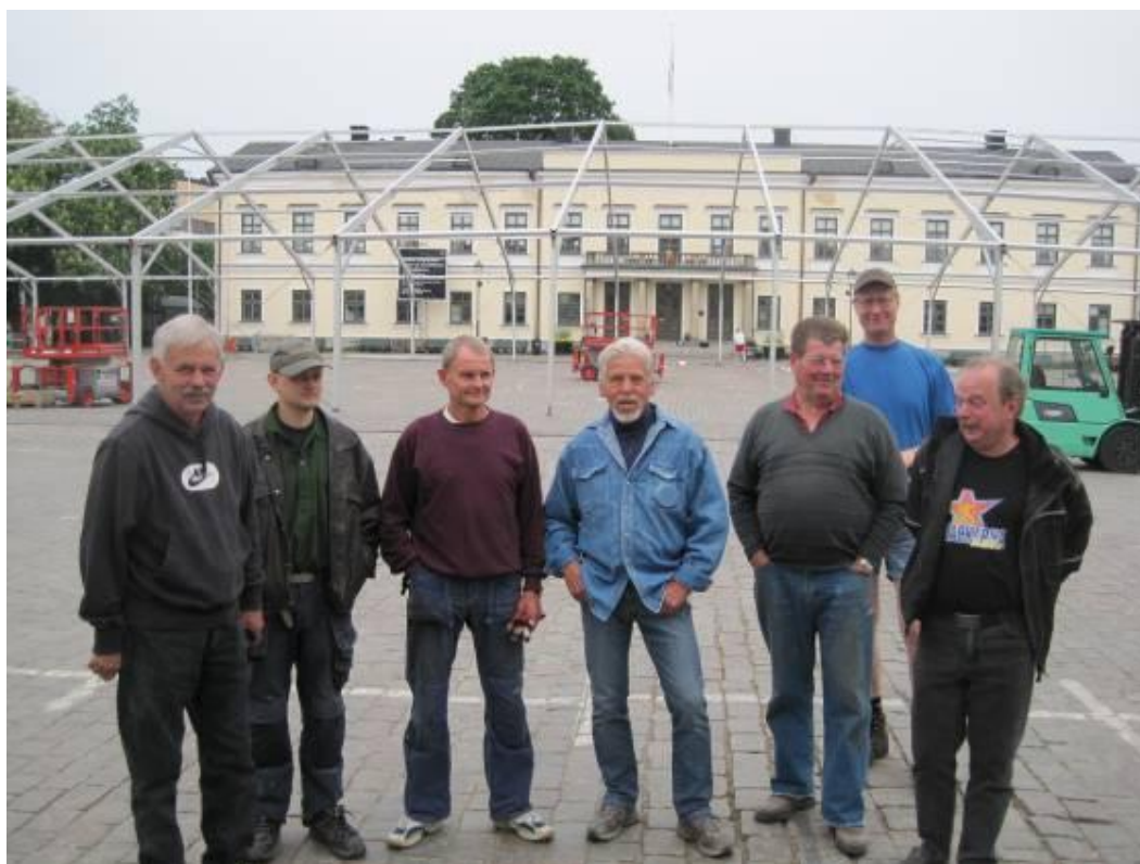
Gänget framför den färdiga stommen. Sen var det dags med såväl takduk, väggduk och bordsdukning.

Sagt och gjort. Tillsammans med arbetsledare från Norge så byggde vi det största tält någonsin i södra Sverige. Inte mindre än 75x30 meter och en takhöjd på nära 10 meter. Detta var både en ny och trevlig upplevelse och tack vare ”järngänget” så klarade vi både tältresning och nedrivning på en dags kortare tid än vad arrangörerna räknat med.