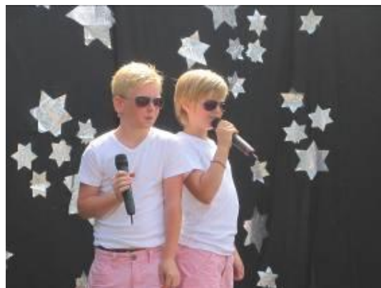
Åbys coola killar

Dagens aktiviteter var nu slut och det var dags att gå hem och förbereda sig för kvällens.