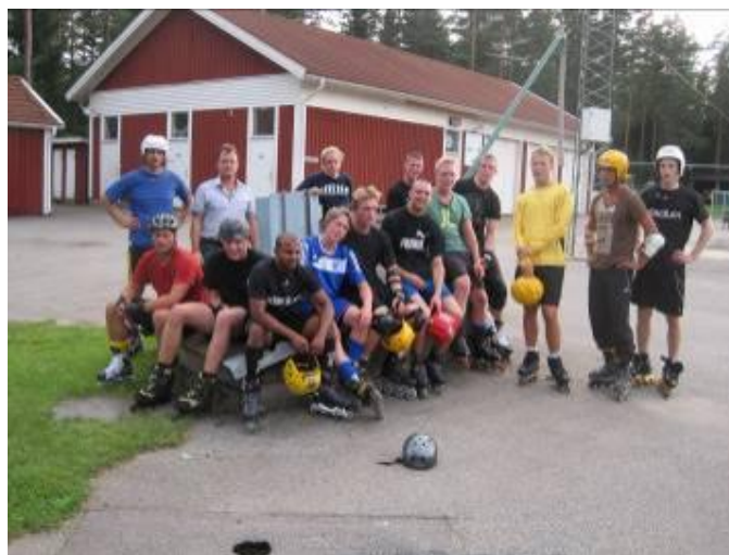
Grabbarna pustar ut efter inlinesträningen