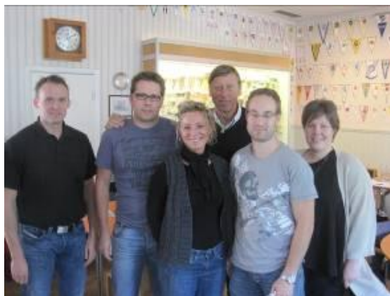
"Bengan" med några av våra duktiga ledare

Han använde följande värdefulla tankar "Behandla andra – som andra vill bli behandlade" . Att vara med en förening skall vara ett mervärde. Viktigt är att när man löser konflikter måste det vara två vinnare. Medan han tyckte att handboll är en akademisk sport beskrev han ishockey som slagsmål med pinnar. En föreläsning på två timmar är ju svår att sammanfatta på en A4 sida