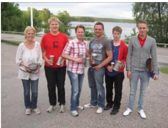
Några av årets duktiga pristagare