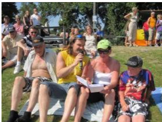
Allsång i gröngräset

Strålande, varmt väder och slussfestivalen var igång igen. Förberedelserna flöt på som vanligt då många kan sin uppgift sedan länge.