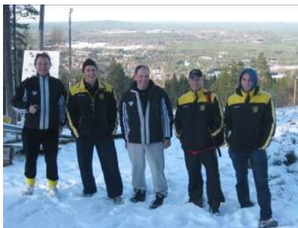
Gubbarna njuter av vintervädret

Sista dagen tränade vi och sen åkte vi hem.