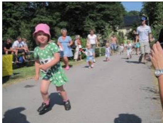
Små sprinter tjejer

och nummerlapparna fästes fast. Först ut var 0-6 åringarna följt av 7-10 åringarna och det blev mycket spring vill jag påstå in i mål där diplom och godis väntade.