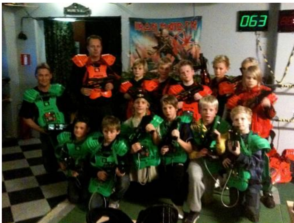
Rambo släng dig i väggen här kommer de tuffa killarna

Året avslutades på Lasergame, där även de stora grabbarna fick vara med och leka.