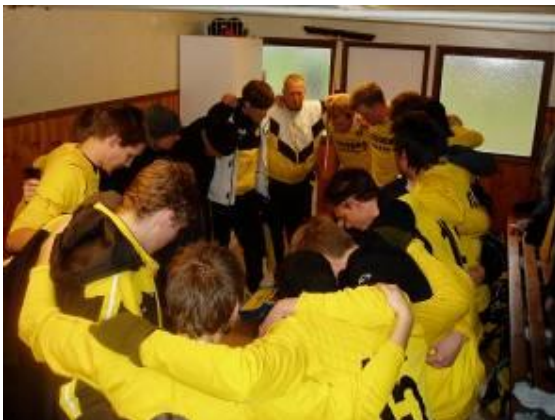
Peptalk inför matchen

Isiga grusplaner långt in i Mars och mycket begränsat antal spelare vid våra träningar var väl inte riktigt den uppladdning man hade önskat inför vårsäsongen. Men kanske det var det som bäddade för framgången. Nästan hela första omgång gick som på räls. Vi kände verkligen flytet och hade chans på andraplatsen, innan säsongsuppehållet.