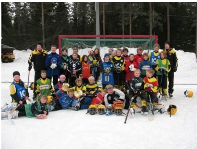
Ungdomar på årets sportlovsbandy