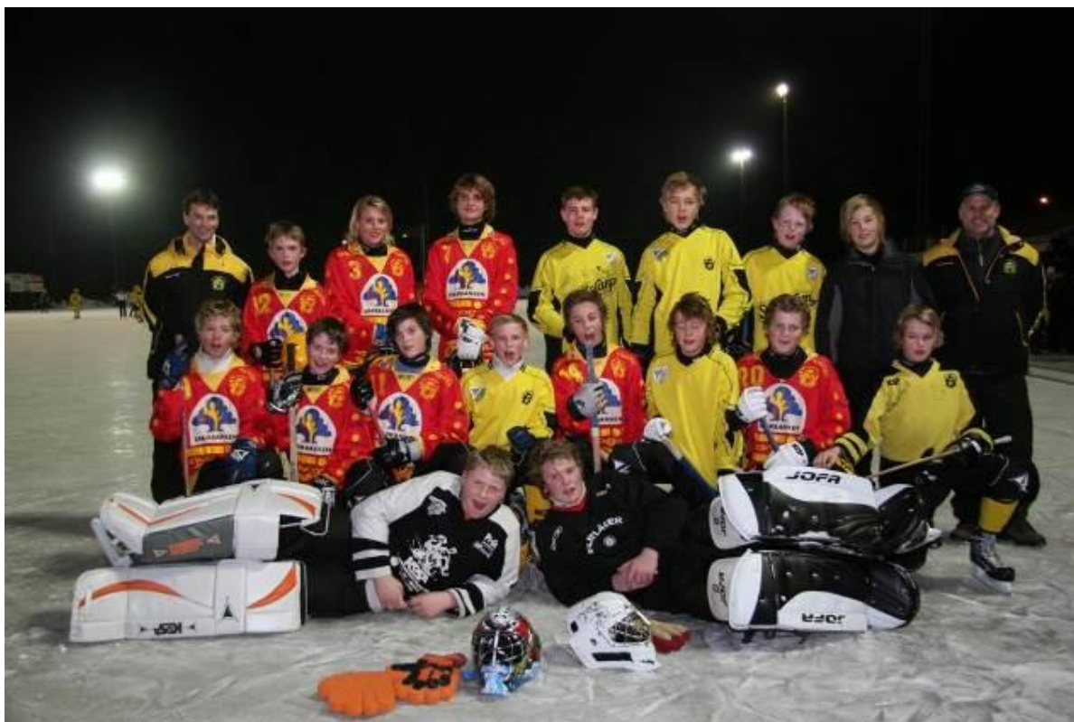
Delar av P15 gruppen på årets bandyavslutning i Åby.

I seriespelet ställde vi upp med två lag i Smålandserien. I grupp 1 kom vi på en tredjeplats och i grupp 2 slutade vi som seriesegrare.