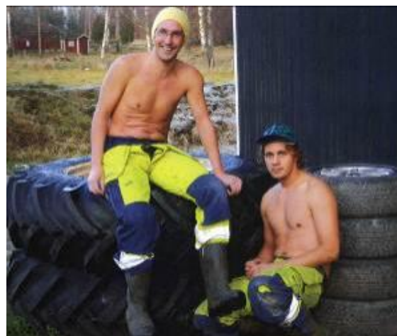
Bilder från årets kalender Åby Tjuredas Bandybönder