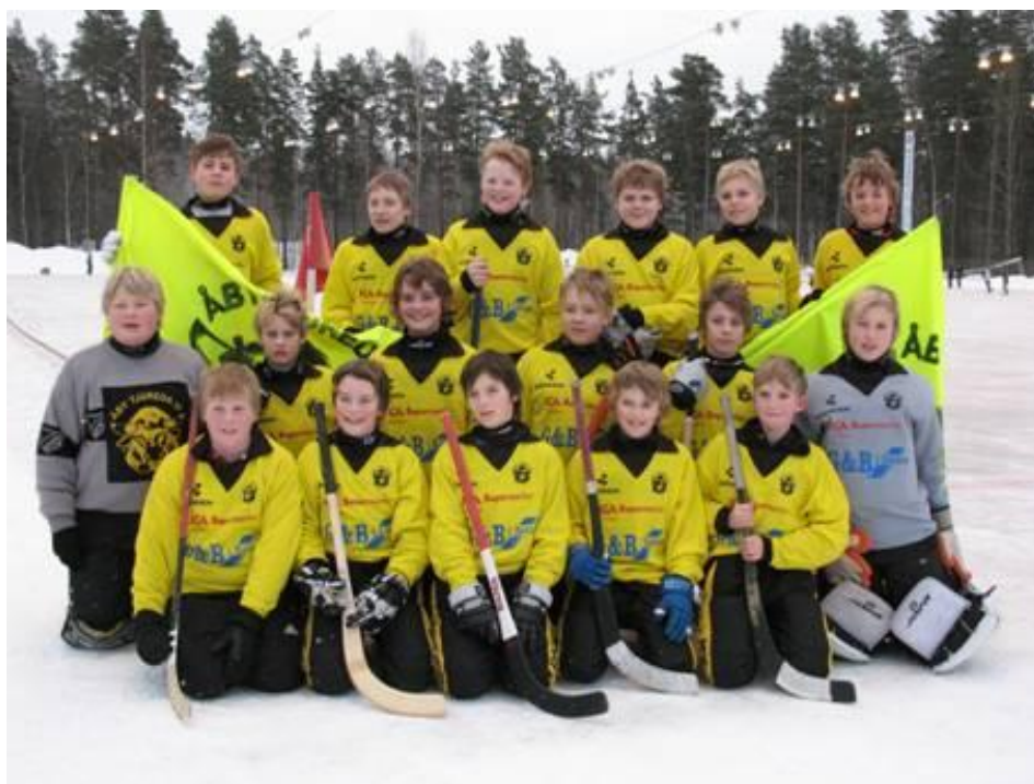
Borlänge Cup 2008