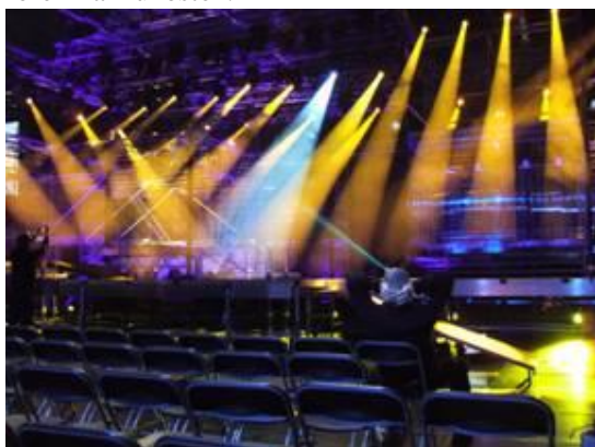
Kolla, alla lamporna på rätt plats

Vi hade ett 15-tal långtradare som skulle tömmas på innehåll. Det är en fröjd att se de olika ansvariga som har stenkoll på i vilket hörn just deras låda skall hamna. När det var dags börja "bygga" hamnade jag bland belyningsgubbarna. Här gällde det att hänga upp strålkastare allt från ett par kilo tunga upp till 30 kg. Vi behövde inte gå på gym på kvällen för att lyfta skrot. Vi bodde på ett vandrarhem i närheten som tidigare varit logement för militärerna. Det var helt ok även om man önskat en spis och diskbänk för att förenkla frukosten.