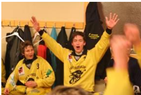
Lyckliga och duktiga killar

Säsongen med U-17 träningsgruppen bestod av 8 stycken 91-or, 8 stycken 92-or och 5 stycken 93-94 or. Försäsongsträningen var lite splittrad. En del tränade med A-B lag och några med U-15. I Åby var spelarna delade i olika grupper då U-17 endast tränade ihop en dag i veckan. Men med duktiga spelare så nådde vi ändå långt i P-17 SM.