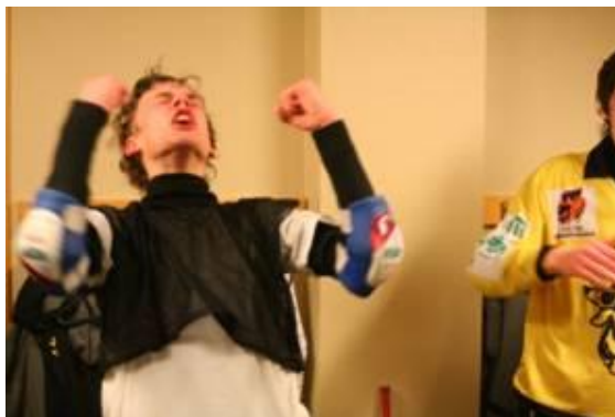
En bild kan säga mer än tusen ord

Returmötet var en lång bussresa som började dagen innan match. Där skulle vi möta ett grymt taggat SAIK. Vi hade tre mål att gå på, men det visade sig att det inte räckte. Vi förlorade med 7-1 inför ca 100 personer på läktaren (tror ej det var så många) Efter matchen var besvikelsen stor då vi mötte Sveriges bästa lag.