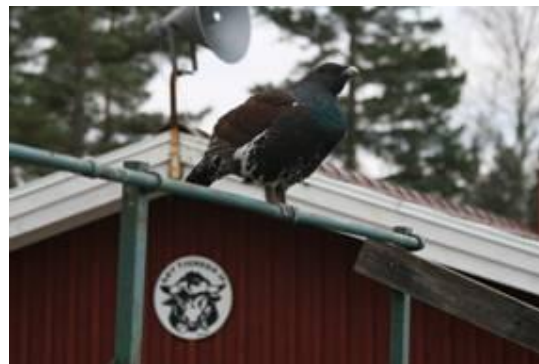
Och så har vi ju en sån tjädra publik

Många föreningar har det tufft men Åby är en förening som har vuxit, mycket till stor del pga att alla får var med och alla hjälps åt. Vi har alltid haft en stor ungdomsverksamhet och det börjar nu ge resultat även på högre nivå.