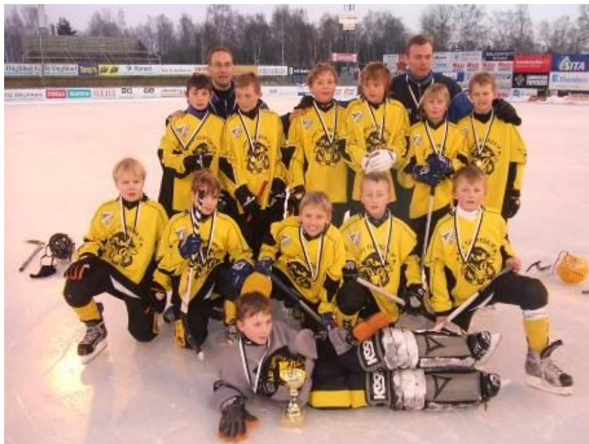
gruppbild Åby/Tjureda pojkar 96