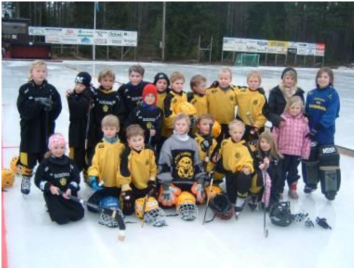
Våra blivande stjärnor

Detta år fick de en 10: onde plats, men vänta bara. De flesta spelarna får vara med 3 år till i samma åldersgrupp som de var med i, i år. Vad sägs om detta??