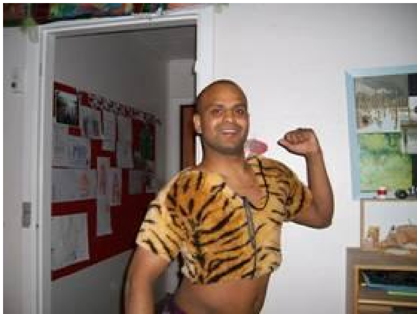
Ett helt vanligt träningsläger

Så hur går det i år då? Ifjol lovade jag för mycket när jag sa att det skulle bli en rolig säsong för Åby/Tjureda. Sist i tabellen och minst gjorda mål av alla lagen är kanske inte riktigt vad doktorn ordinerade. Vågar jag sticka ut hakan i år igen? Ja det vågar jag. Med tanke på vilken bred och duktig trupp jag har att förfoga över så är vi ett lag som skall hamna någonstans på övre halvan om spelarna ställer upp och tränar på ett bra sätt. Vi har en bra mix av äldre rutinerade spelare tillsammans med en yngre grupp som sprudlar av överskottsenergi. Kan jag få dessa två grupper att arbeta tillsammans som ett lag så skall vi vara med på den övre halvan. Och jag kan lova er, trots att vi har ett gemensamt utvecklingslag, att inga medel är förbjudna när det gäller att knäcka Tolg i två matcher i år.