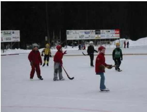
Bandyns dag för Åby skolan