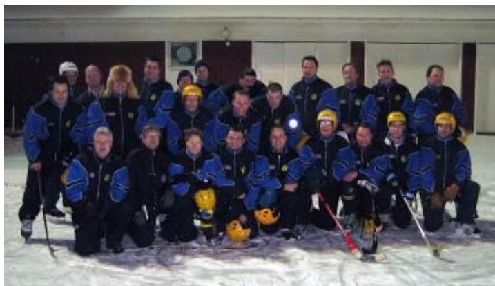
Alla våra duktiga bandyledare