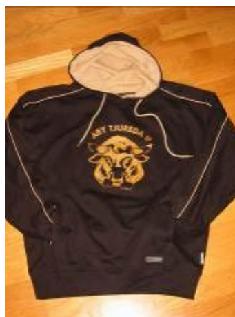
Collegetröja 350 kr