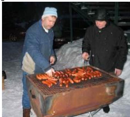
500 korvar räckte inte