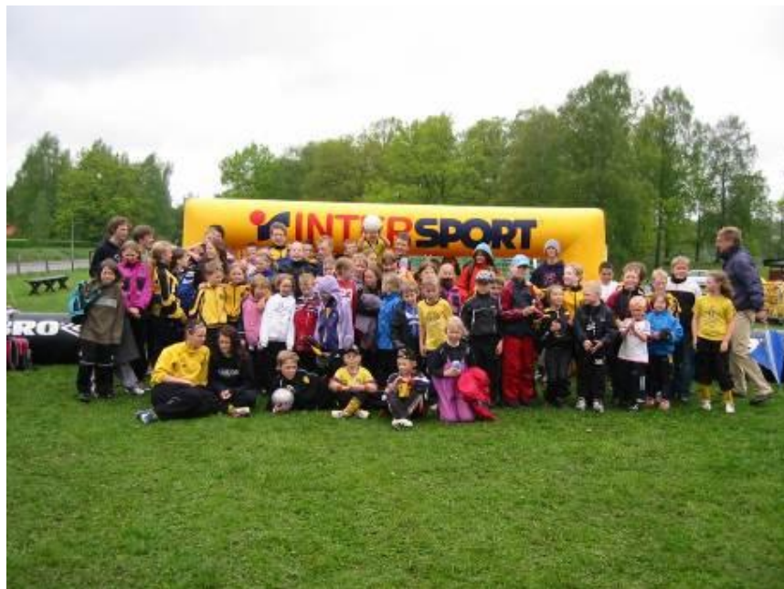
Nöjda och trötta barn från Åby skola