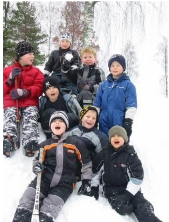
Lek och bus i snöhögen