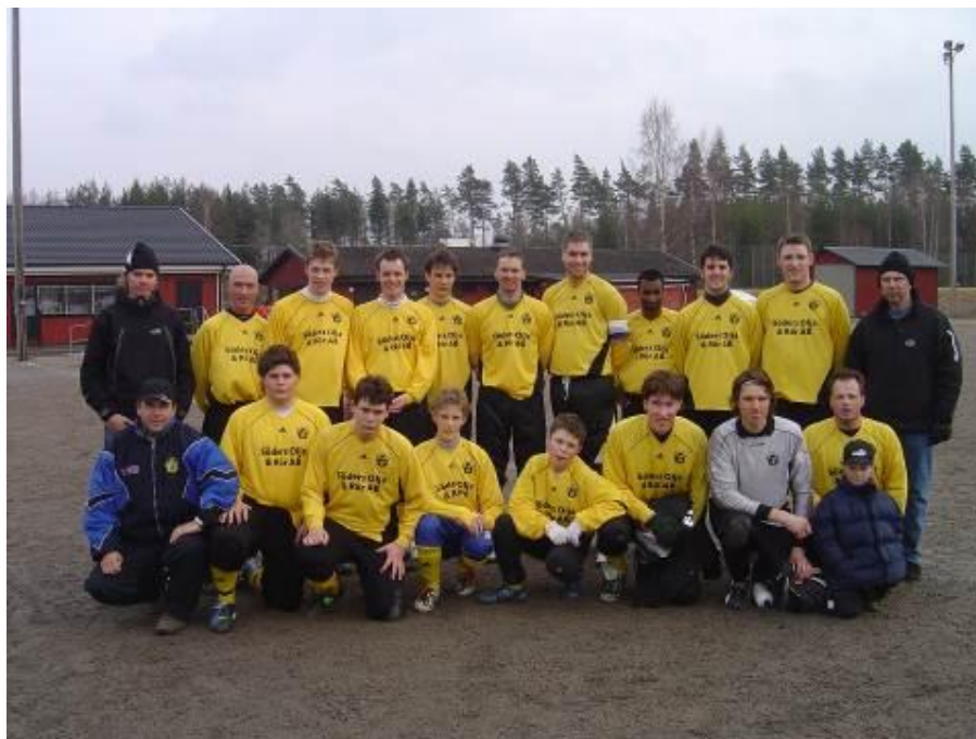
Det taggade herrlaget 2006