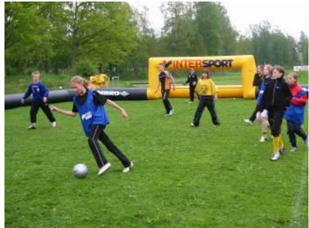
Motståndarna är helt bortdribblade

Ännu en lyckad dag med fotbollsbingarna. Ett samarbete i handslagsprojektet mellan Föreningen och skolan.