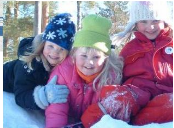
Söta tjejer i snöhögen