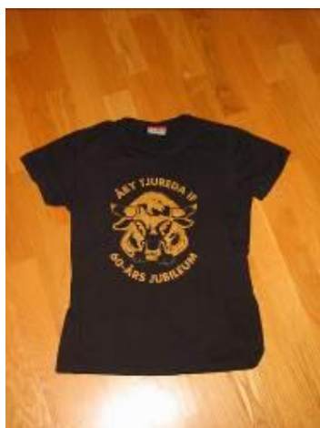
T-shirt 150 kr

Nya snygga Åby tröjor finns att köpa hos Eivor tel 93189