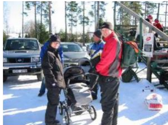
Föräldrarna njuter i solen