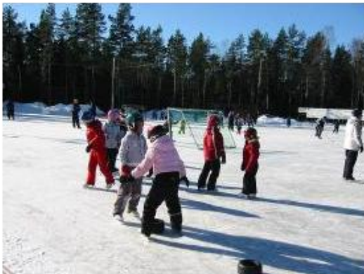
Många var dom som ville åka skridskor denna fina vinter