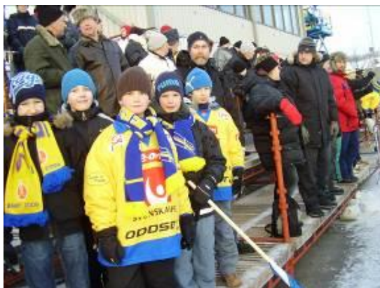
I väntan på den stora matchen

Sverige stod som ni kanske redan vet som arrangör för årets senior VM i Bandy. En av matcherna nämligen Sveriges semifinal var förlagd till Linköping. Detta uppmärksammades även av Åby-Tjureda som tidigt planerade att försöka få ihop en buss med ungdomar och ledare som kunde åka och titta på bandy på absoluta toppnivå.