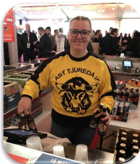
ÅTIF-Tjuren på Studenternas. "Bandy Dä Ä Åby Dä".

Att ÅTIF nu etablerat sig inom bandyfamiljen märkte jag tydligt då många uttryckte sig att det var synd vi inte lyckades att nå elitserien. Trots detta syntes ÅTIF verkligen under SM-helgen. När jag kom in i serveringstältet vad fick jag då se? Jo en tjej som i baren hade på sig ÅTIF-Tjuren och serverade för fulla muggar. Detta ögonblick fick jag naturligtvis inte missa.