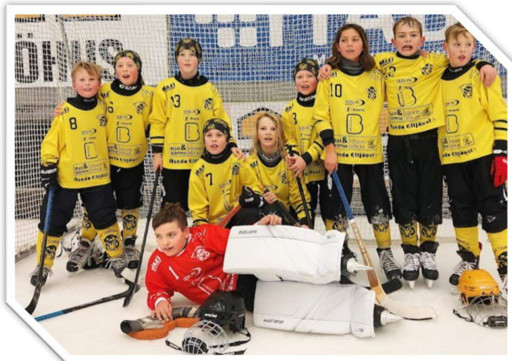
Nöjda killar som 3:a av 10 lag i Vänersborg

I mars deltog vi även i Beyron cup i Vetlanda. Det blev en mycket lång dag med matcher från kl 8 till kl 18. Vi spelade 8 matcher där vi hade 5 vinster och 3 förluster. 2 av de senare var jämna matcher mot Åbys F13 och Nässjös P11 och en lite större förlust mot Vetland