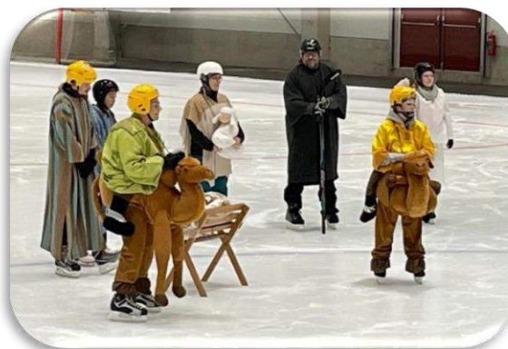
Juleangeliet på is

Även församlingens Brassegrupp fanns med för att förhöja stämningen ytterligare genom att spela med i julsalmerna. Efteråt bjöds det på Korv med bröd. Så trevligt när vår arena kan användas till andra evenemang också. Vi ser fram emot fler samarbeten i framtiden.