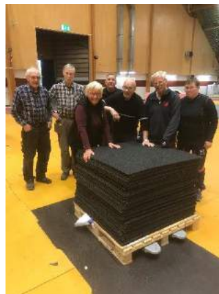
Järngänget har plockat upp mattorna efter Yrkes-SM