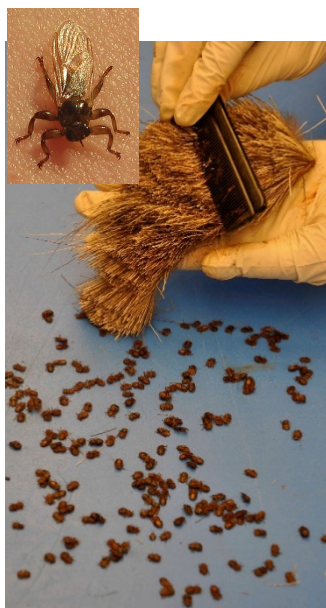
Älgpälens finkammats. Ut faller larver från älgflugor (översta bilden) och fästingar.

Det är ett av flera nya projekt om älgar, klövvilt och skogsbruk i Alnarp. I ett av dem är målet att hitta ett enkelt verktyg (en app i telefonen) där skogsägen kan inventera betesskadorna och räkna på kostnaderna för olika åtgärder.