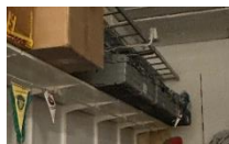
I de gråa backarna inne i förrådet finns toastjärn med mera.