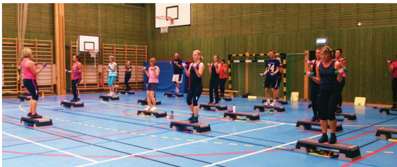
Ett corepulspass med step up bräda och hantlar.