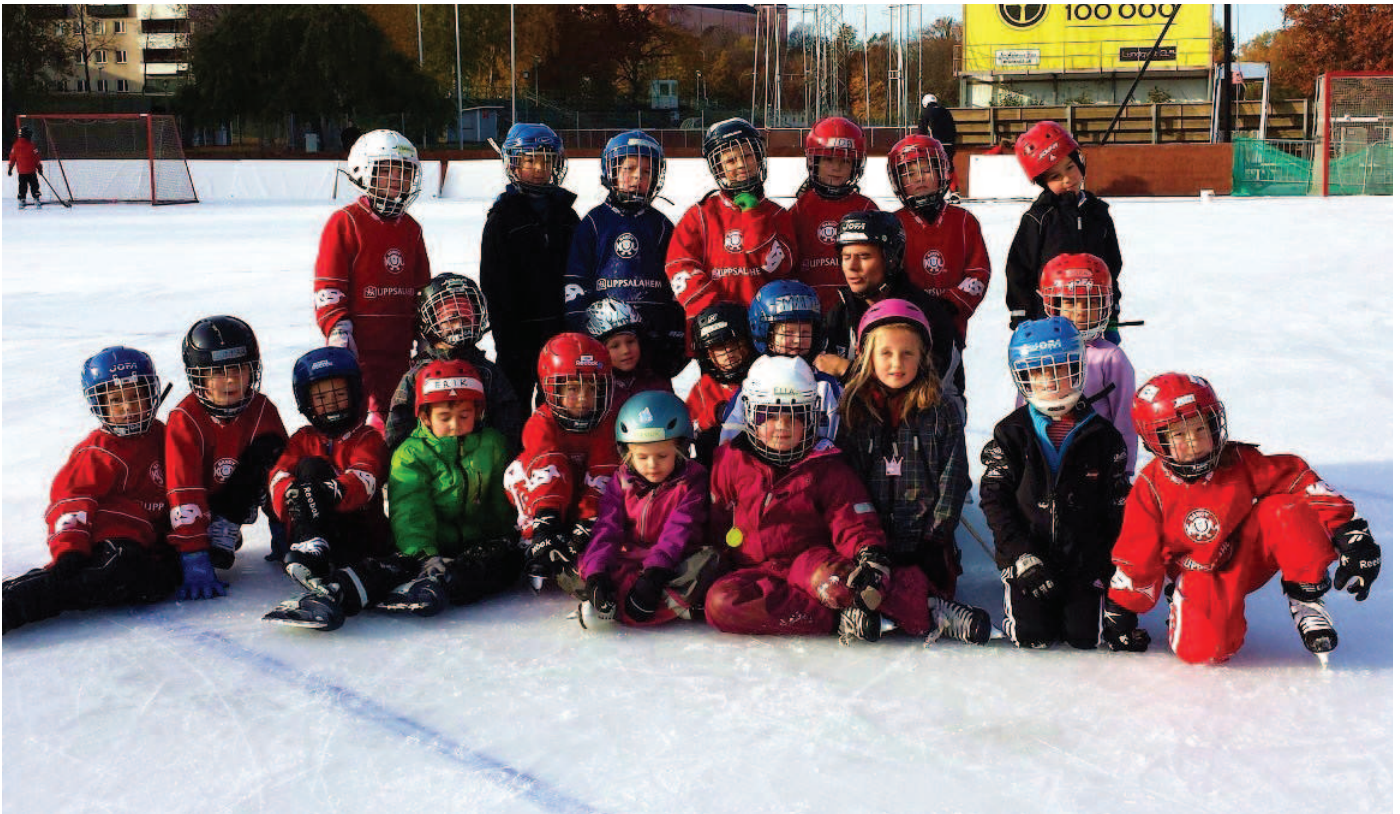
Bandykul på Studenternas.