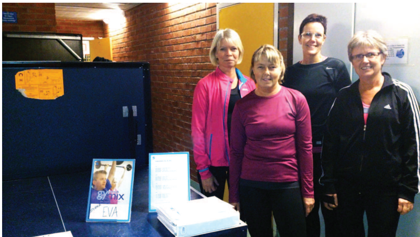
Ledarna tar emot i dörren.