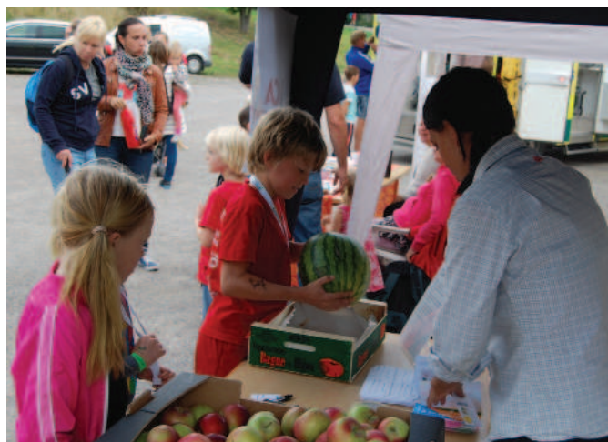
ICA Sävja har tävling hur mycket melonen vägde.