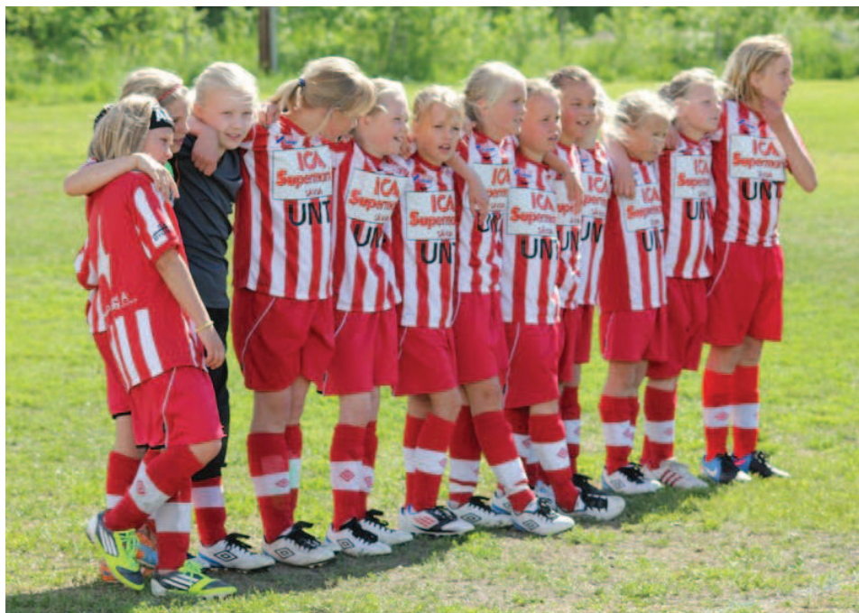
Alla tjejer i F03 under UNT-cupen.

I år var vi för första gången med i UNT-cupen. Det var en upplevelse utöver det vanliga. UNT-cupen gick av stapeln 7-9 juni i Storstora och de hade gjort cupen till en härlig familjefest. Tjejerna var taggade till tänderna när domaren blåste i pipan kl. 13.00 på lördagen och matchen mot Lagunda AIK var igång. En match som gick helt och hållet som vi ville. När slutsignalen ljöd så kändes vinsten