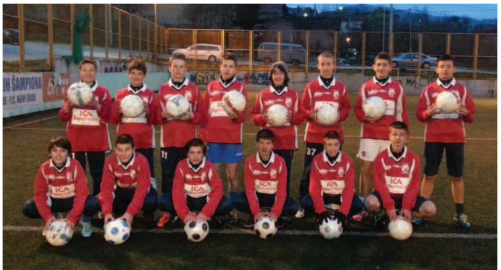
Lag FK Novi Grad med fotbollsutrustning från Danmarks IF.