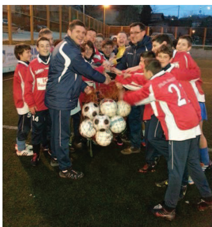
FK Novi Grad får utrustning från Danmarks IF. Läs mer på sid 11.

Se fler bilder från DIF-dagen på sid 12.