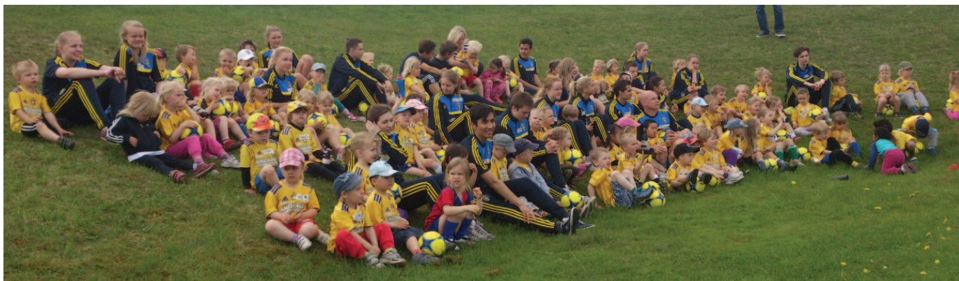
2013 års Leka Lär gäng samlat på Danelid.