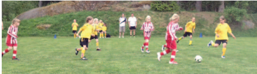
F04 under en match.

Efter en lång vinter med ett par sammandrabbningar under våren var det äntligen dags att kliva ut på riktigt gräs. Tjejerna som är vana sedan förra säsongen att oftast få spela under regn på deras matcher fick denna dag (1 juni) riktigt kanonväder med 25 grader varmt när det var dags för cup på Lagga IP. Det var full uppslutning bland tjejerna och vi fick till 2 st lag.