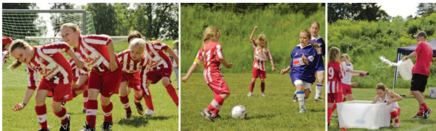
F05 värmer upp, spelar match och har vattenkrig.