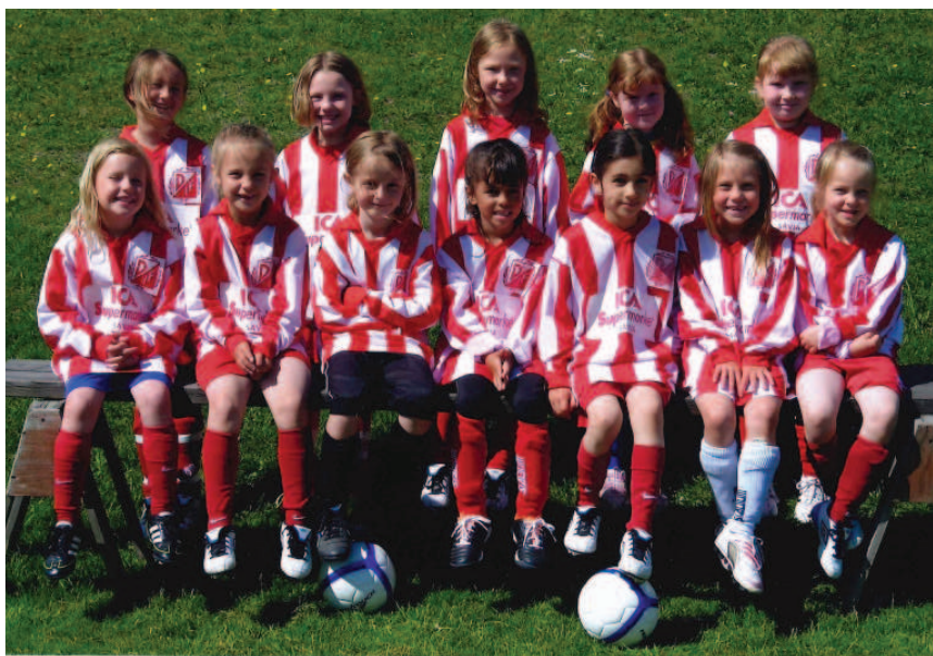
F06 i matchtröjorna.