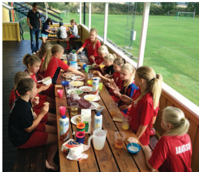
Utomhusfrukost på Danelid.

Tränarna är supernöjda med helgen och konstaterar återigen att det här är ett lag med riktigt härliga tjejer som har kul tillsammans! Alla föräldrar som var involverade i skjutsning och matlagning under helgen gjorde också en fantastisk insats. Det var en rykande åtgång på köttfärssås med pasta, nyrostade frukostmackor och grillade hamburgare.