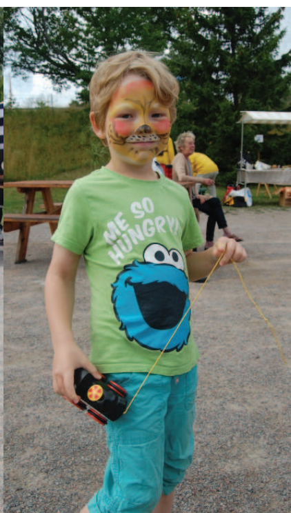
En Tiger som är hungrig.