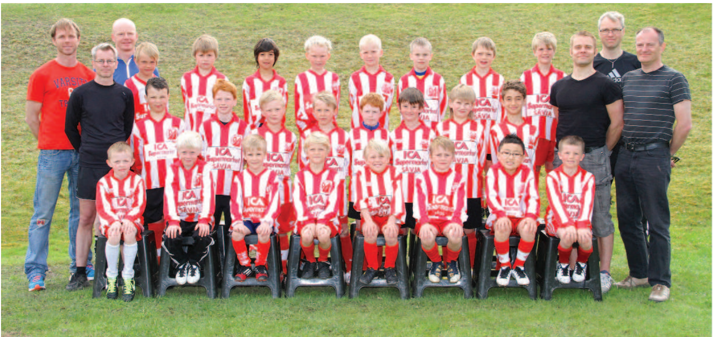
Lagbild på P05.