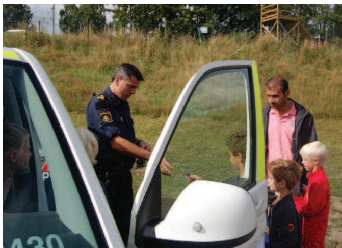
Polisen var också på plats.