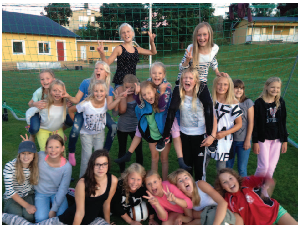
F02 under fotbollshelgen på Danelid.