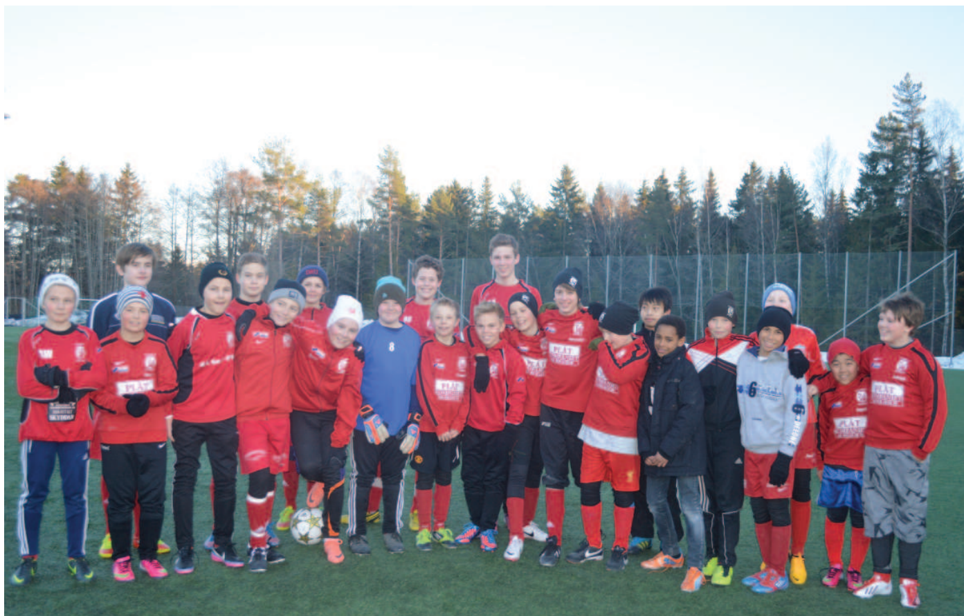
P99 efter en träning på konstgräsplanen på Sävja IP.