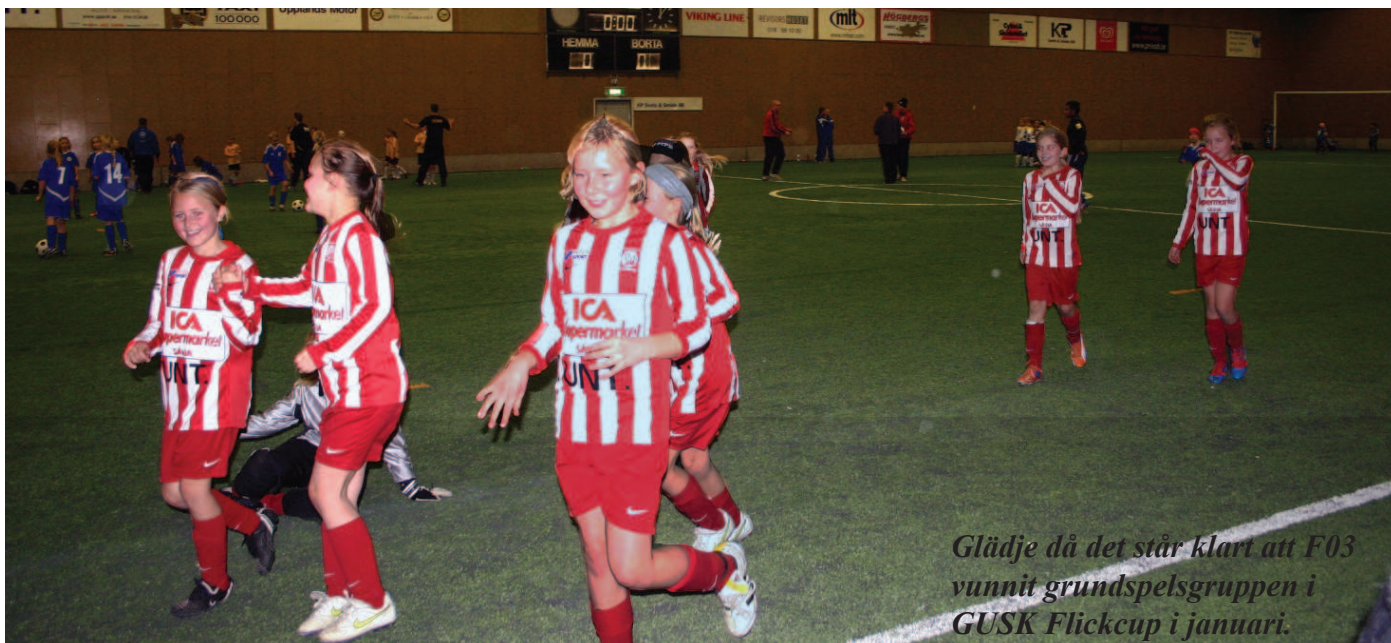
Glädje då det står klart att F03 vunnit grundspelsgruppen i GUSK Flickcup i januari.