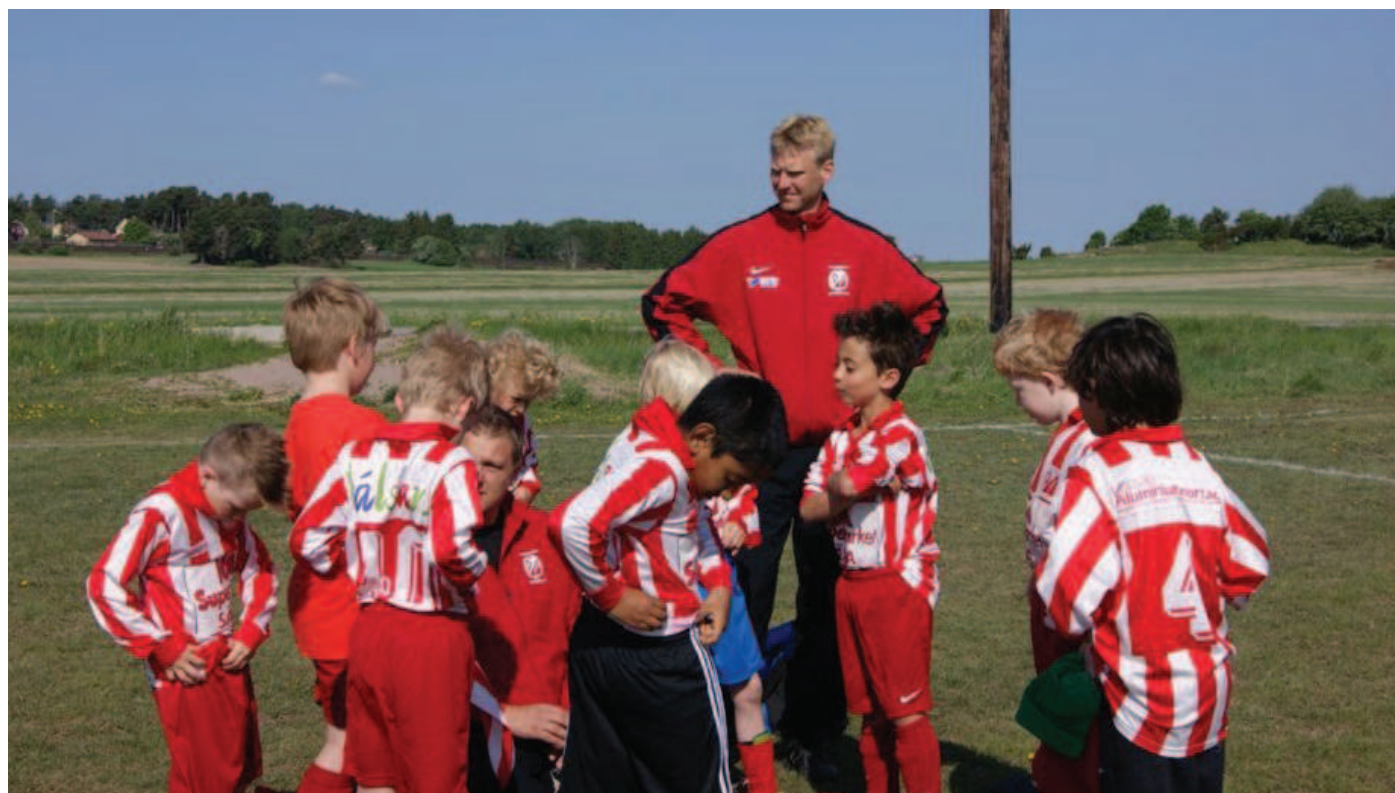
Spelarna i P03 coachas av tränarna.