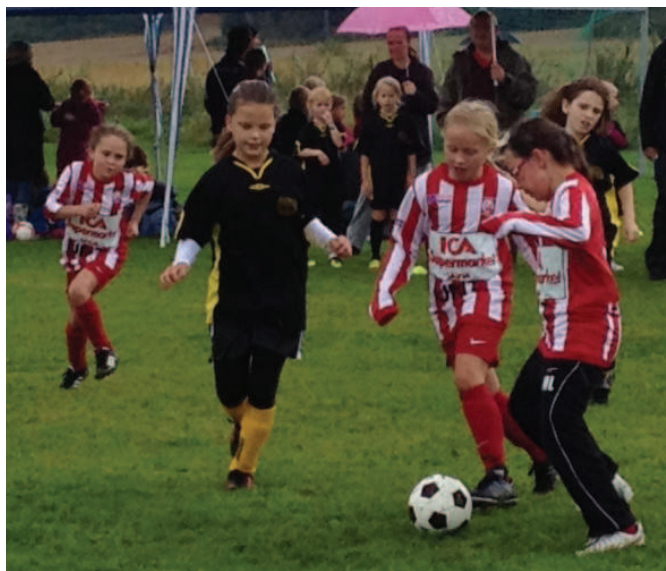
Spelare i F04 under en match.