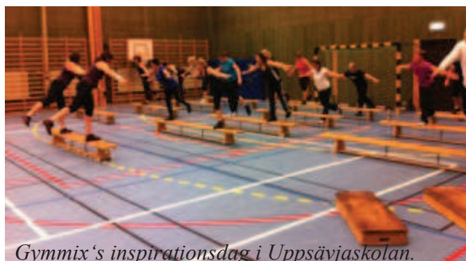
Gymmix's inspirationsdag i Uppsävjaskolan.

Vi erbjuder ett "kombipass" där alla våra 4 ledare