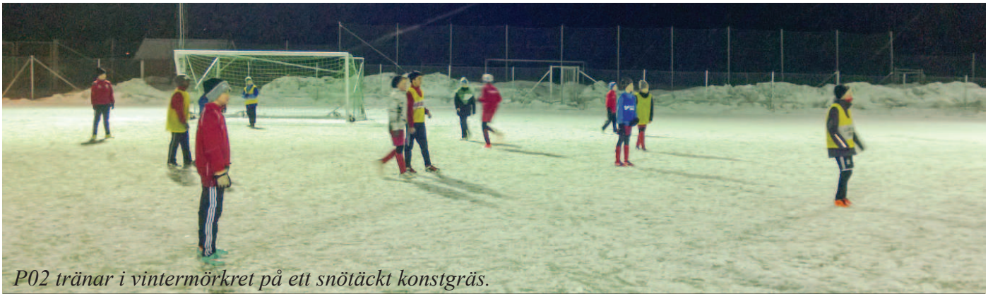
P02 tränar i vintermörkret på ett snötäckt konstgräs.