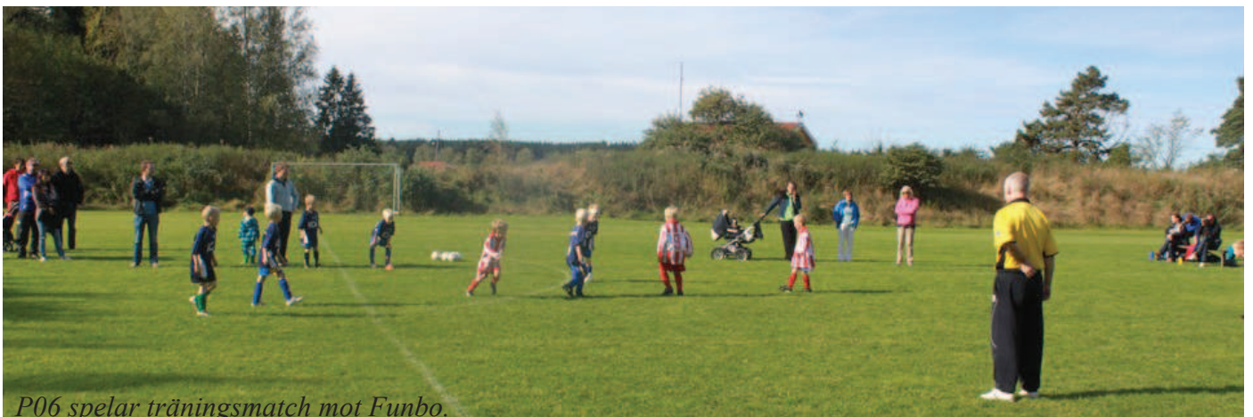
P06 spelar träningsmatch mot Funbo.