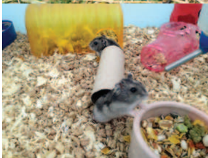
Kaniner och möss från Fäboden fanns att titta på.