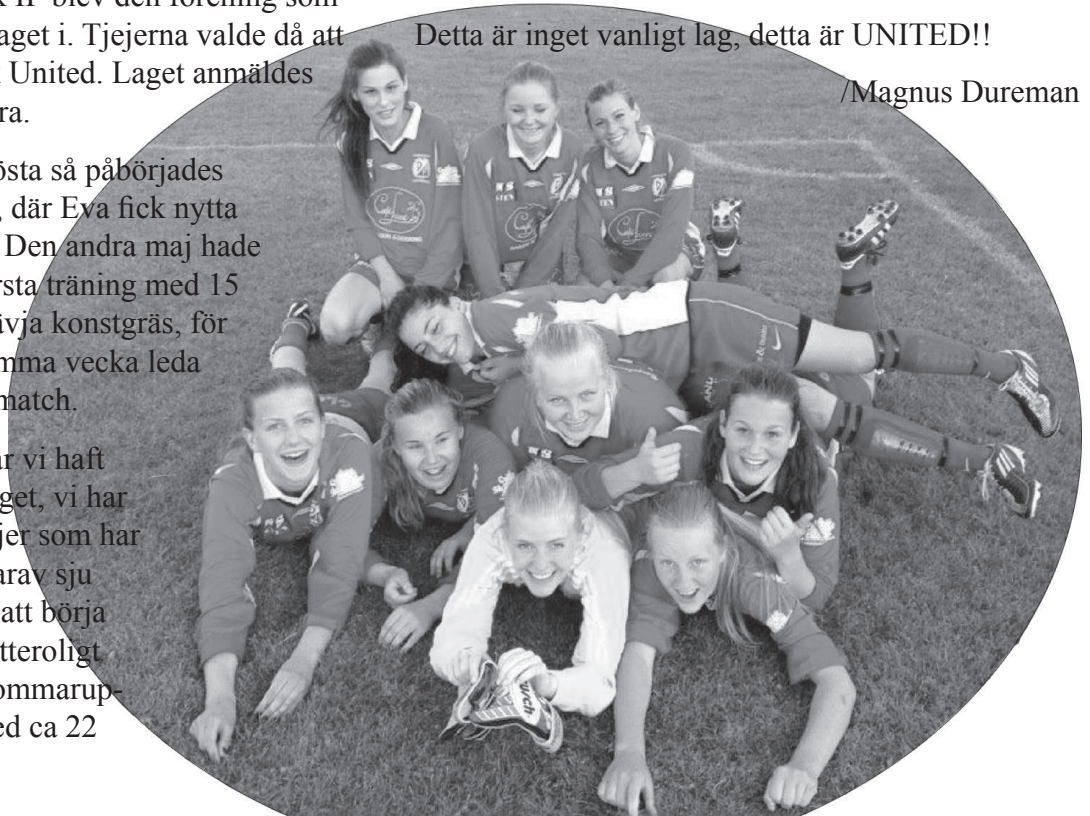
Bilden är tagen efter 6-1 segern mot serieledarna Håbo.