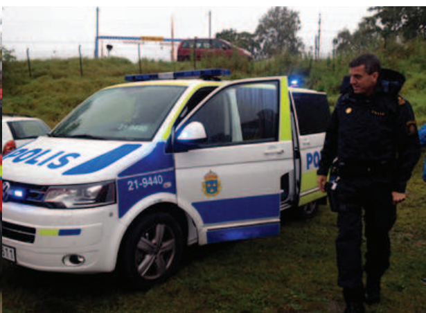
Både brandmän och poliser var på plats och visade upp sina fordon och utrustning.