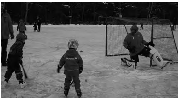
Ovan: Bandykul gör mål på Sirius-målvakten Tv: Alva blivande stjärna