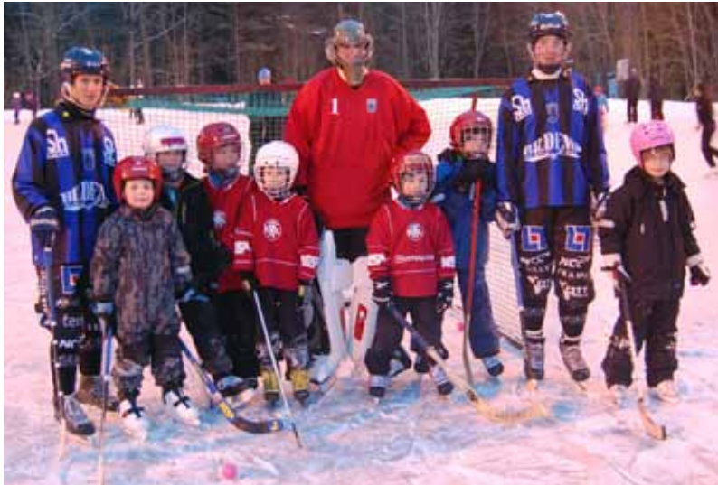
Bandykul med Sirius